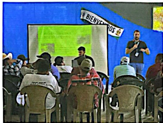
"Otorgamiento de Permisos MAPE y Asesoría en Tema Legal" Macuelizo, Santa Bárbara