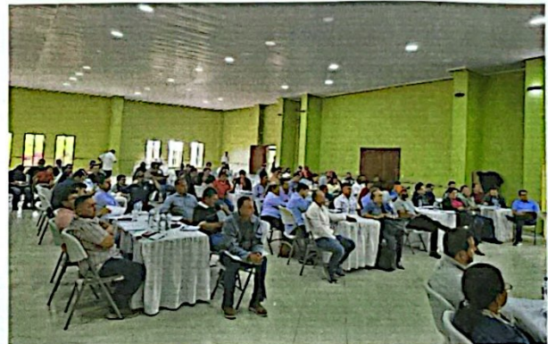
"Socialización de la Política Minera" Santa Rosa de Copán