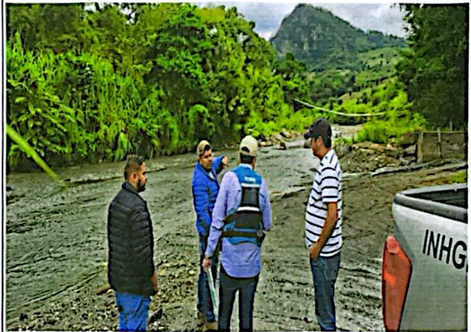
"Otorgamiento de Permisos MAPE" Cucuyagua, Santa Rosa de Copán