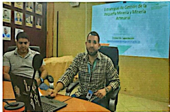
"Estrategia de la Gestión MAPE" Catacamas, Olancho