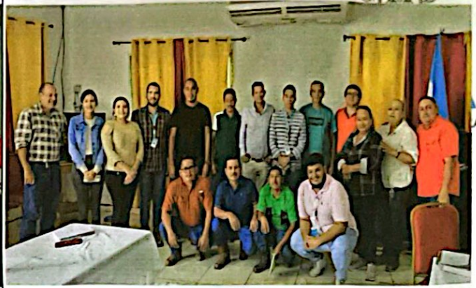
"Otorgamiento de Permisos MAPE", Quimistán, Santa Bárbara