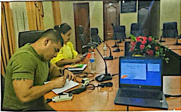
"Otorgamiento de Permisos MAPE" Santa María del Real, Olancho