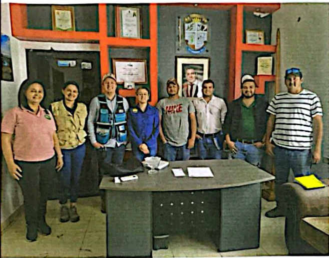
Reunión Virtual en conjunto con la UMAPE para atender consultas breves de la Municipalidad de San Francisco de Ojera, Santa Bárbara