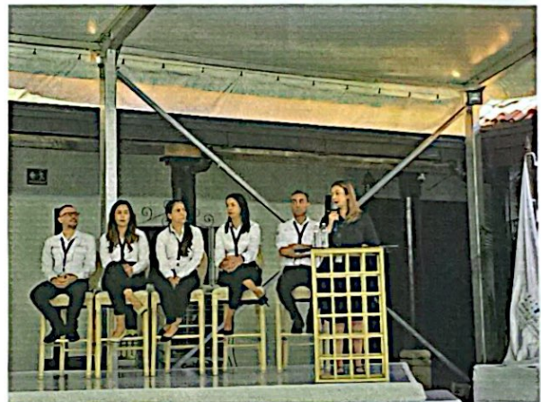
"Socialización de la Política Minera" Tegucigalpa, Francisco Morazán