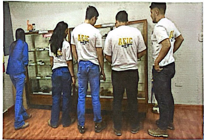
"Presentación sobre el rol de la Autoridad Minera ante la Seguridad y Operaciones Mineras" Estudiantes de la Carrera de ingeniería Civil de la UNAH-VS

Col. Loma Linda Norte, Bulevar Centroamérica, Avenida La FAO, Tegucigalpa, Honduras.