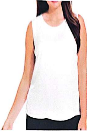
Camisa de Centro

Teléfonos: 2665-8000 Ext. 1128-1271-1132