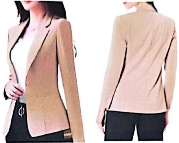
chaqueta color beige