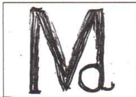
Figura del Fierro

Extendida en el municipio de Santa Lucía, Departamento de Intibucá, a los 20 días del mes de noviembre del 2024.