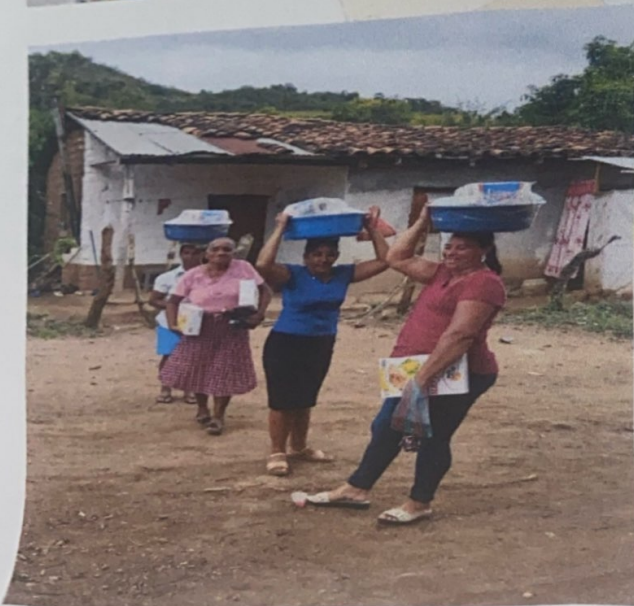
Barrio El Centro, Frente al Parque Central Guayape, Olancho