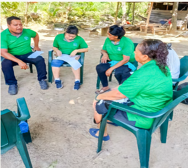
DESARROLLO DE MÓDULO DE CAPACITACIÓN DE CONTABILIDAD BÁSICA DE CAJA DE AHORRO Y CRÉDITO "EMPRENDIMIENTOS DE TAUJICA", TAUJICA, TOCOA, COLÓN.