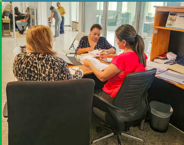
JEFES DE PROGRAMAS Y UNIDADES ENTREGAN EVIDENCIA DE LA AUTOEVALUACIÓN REALIZADA