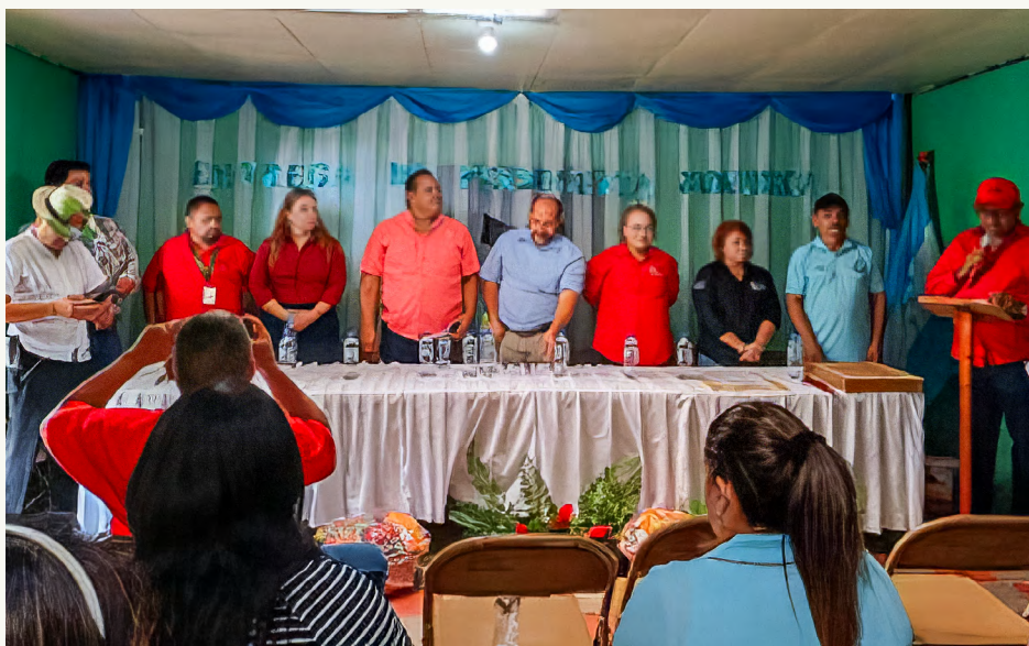
EVENTO OFICIAL DE ENTREGA DE PERSONALIDAD JURIDICA DE CAJA DE AHORRO Y CREDITO RURAL "AMIGOS EMPRENDIENDO UN FUTURO MEJOR", EL OCOTAL, YUSCARÁN, EL PARAISO

P ara mejorar las condiciones de vida de los productores, por medio de la legalización de sus organizaciones y apoyo al funcionamiento de las cajas de ahorro y crédito para la sostenibilidad de sus acciones, DICTA apoya este sector, por medio de mecanismos que garanticen la organización y movilización para la defensa de sus intereses.