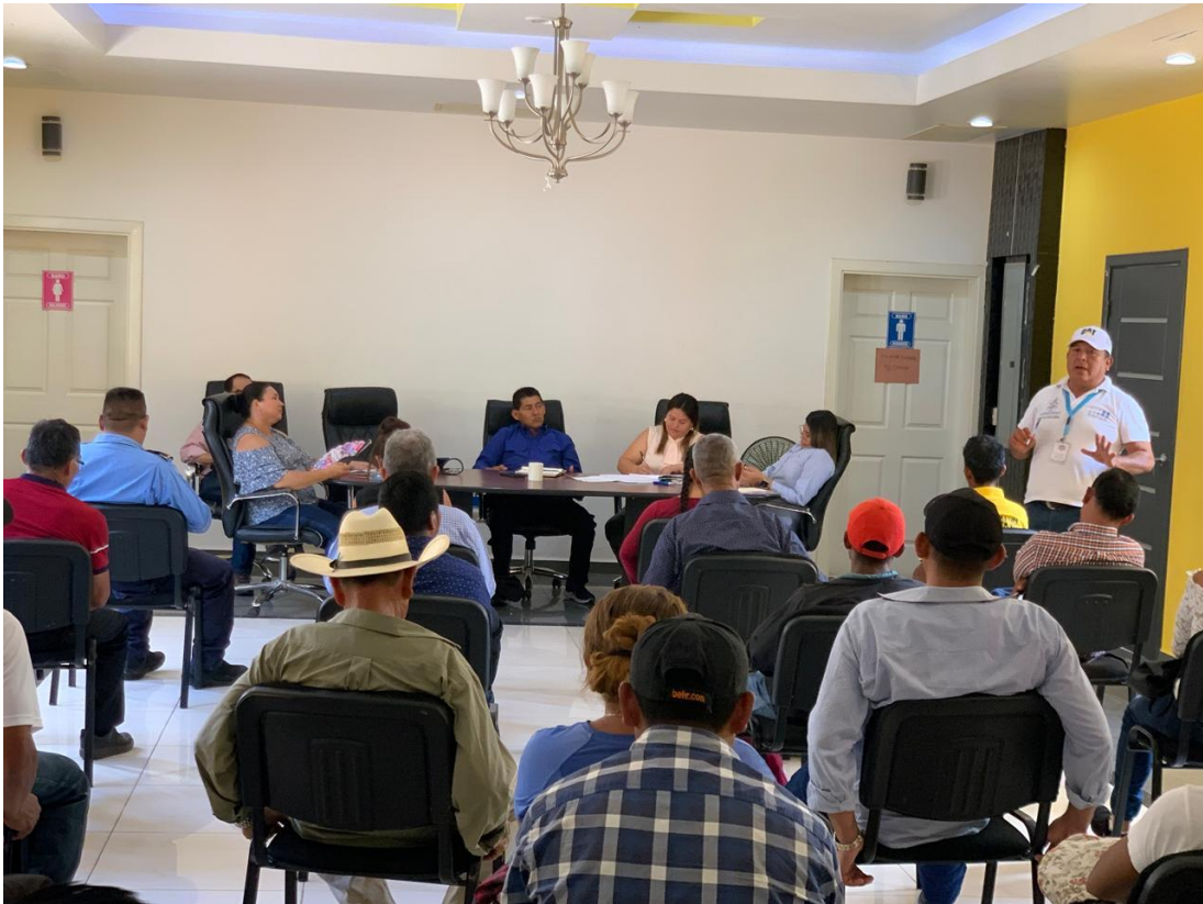
Vado Ancho, El Paraiso 01/07/2024, Depto de Secretaria.