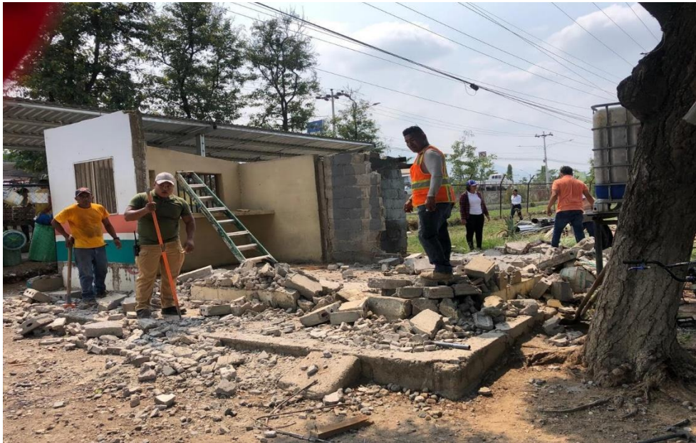
Demolición de la sala de ventas.