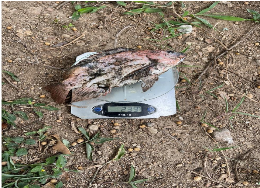
Pez de la primer laguna