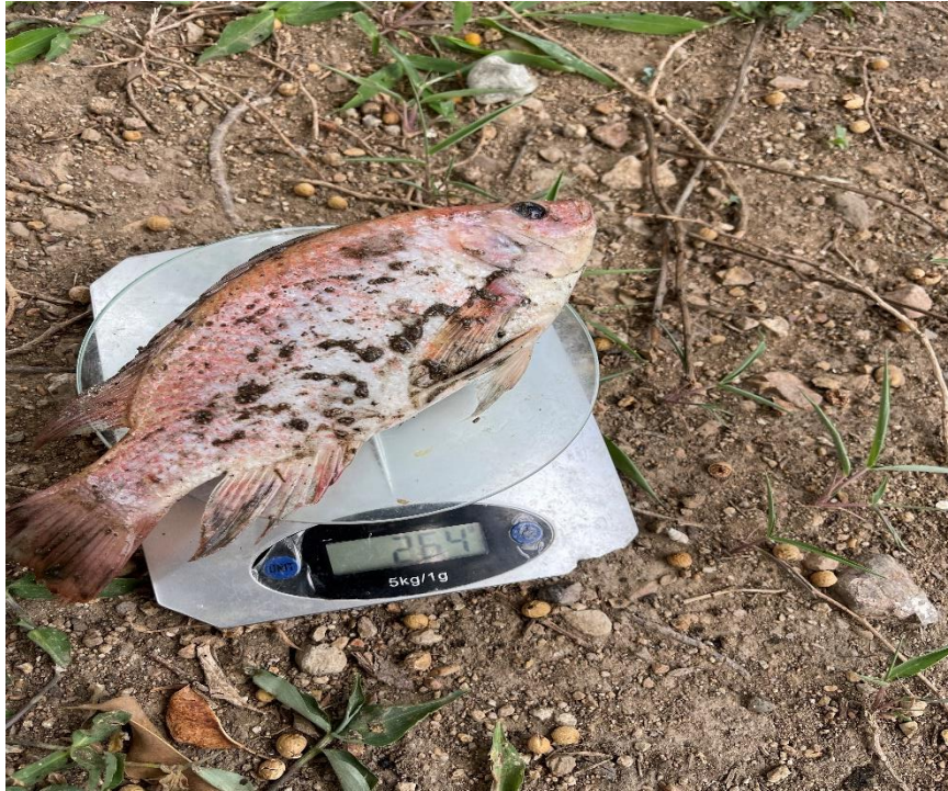
Pez de la segunda laguna