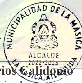
Lic. Ovidio Naún Turcios Calidonio Alcalde Municipal La Música, Atlántida

Esperamos contar con su presencia y juntos contribuir al desarrollo de nuestro municipio.