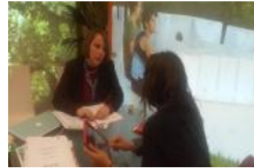
Rueda de Negocio MITT