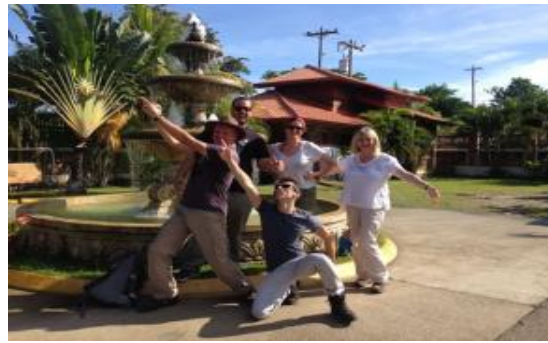
Reino Unido y Brasil.