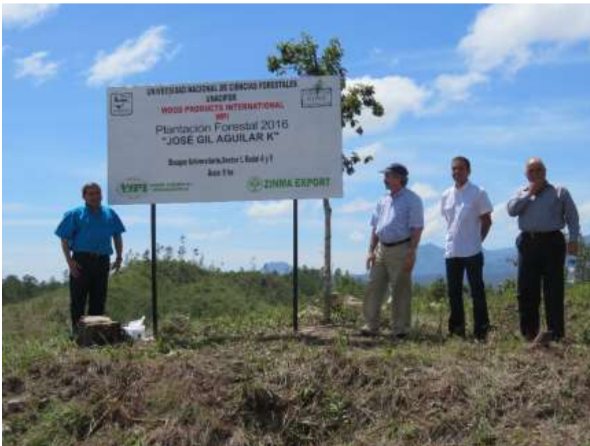
Ilustración 5: Firma de convenio de cooperación con Empresa Privada para realizar plantaciones forestales en áreas de UNACIFOR