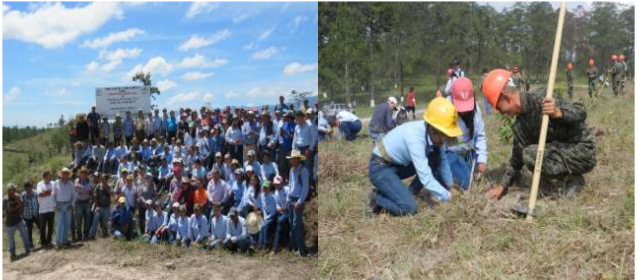
Ilustración 6: Práctica de módulo de manejo de plantaciones forestales en áreas de UNACIFOR y Parque Municipal Calanterique, en coordinación con las Fuerzas Armadas de Honduras.