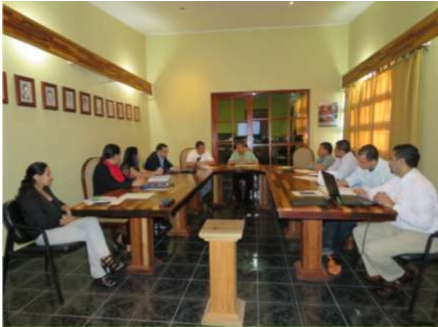
Ilustración 7: Miembros del Comité Control Interno en la preparación de la jornada de evaluación del Control Interno Universitario en coordinación con personal de ONADICI