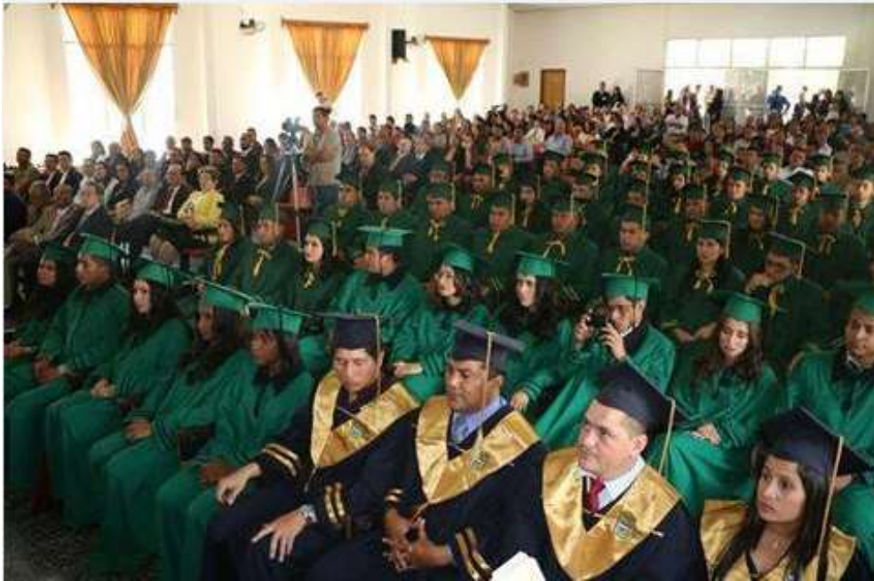
Ilustración 13: Alumnas y Alumnos graduandos 2016