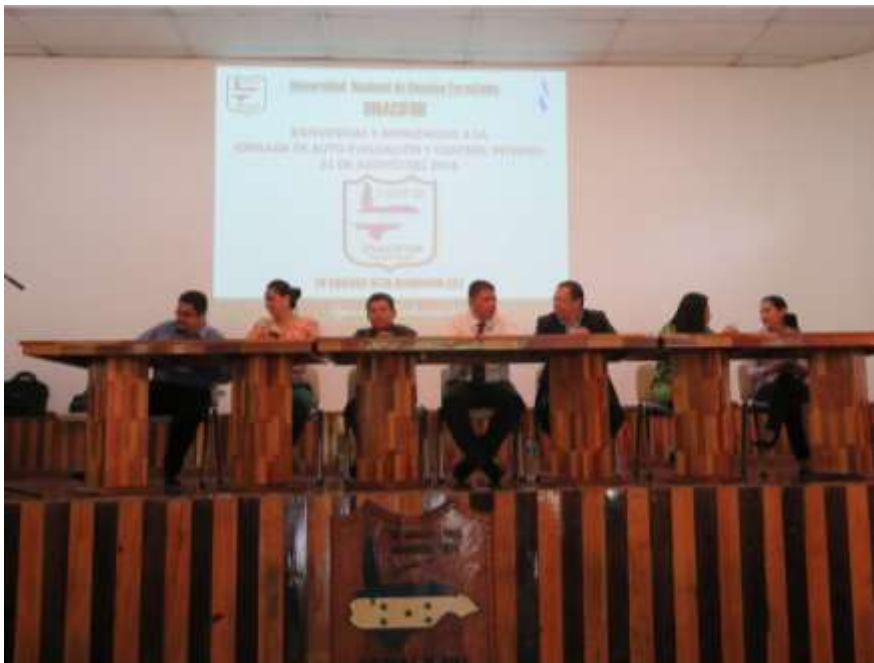
Ilustración 8: Jornada de evaluación del Control Interno Universitario desarrollada en coordinación con ONADICI