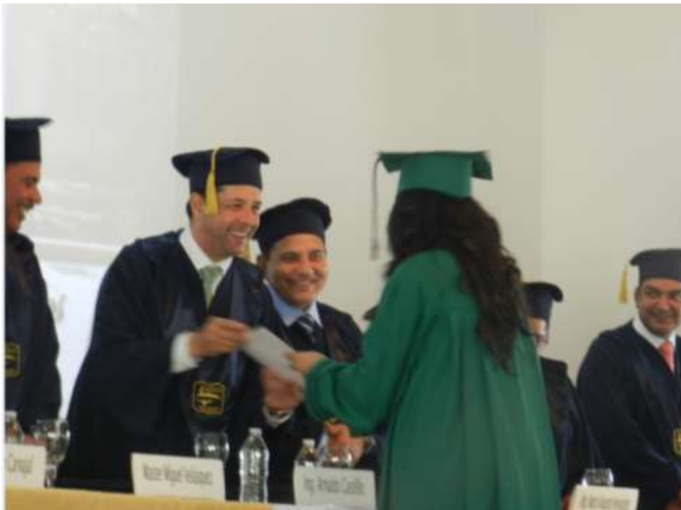
Ilustración 14: Entrega de títulos a los graduandos por los miembros de la mesa principal