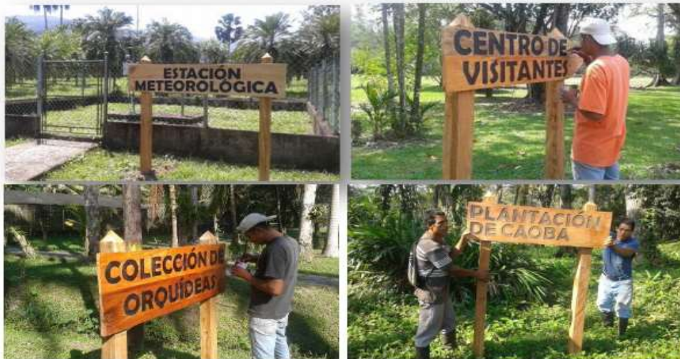
Figura 2. Rótulos ya finalizados, colocados en diferentes áreas del Arboretum