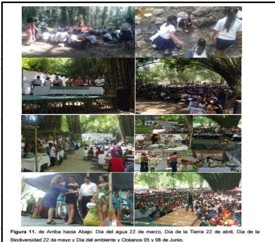
Figura 11. de Arriba hacia Abajo: Día del agua 22 de marzo, Día de la Tierra 22 de abril, Día de la Biodiversidad 22 de mayo y Día del ambiente y Océanos 05 y 08 de Junio.