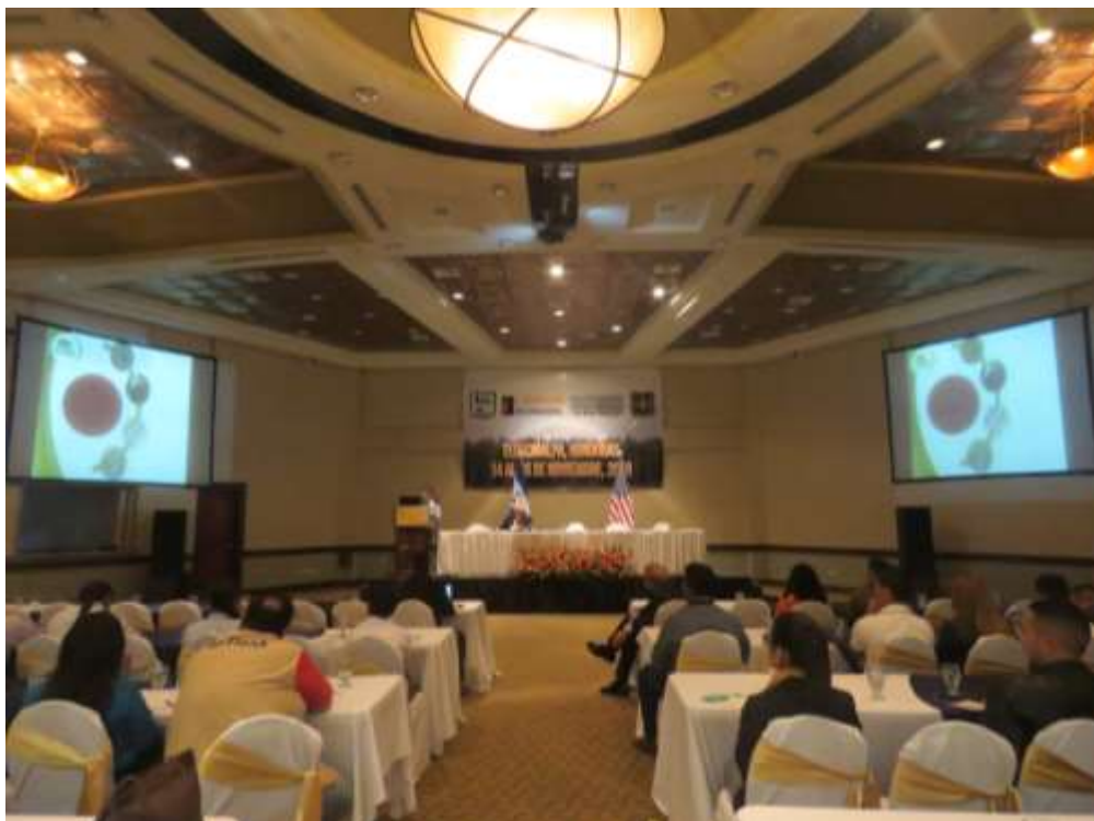
Ilustración 10: Conferencia magistral en el V Simposium Internacional