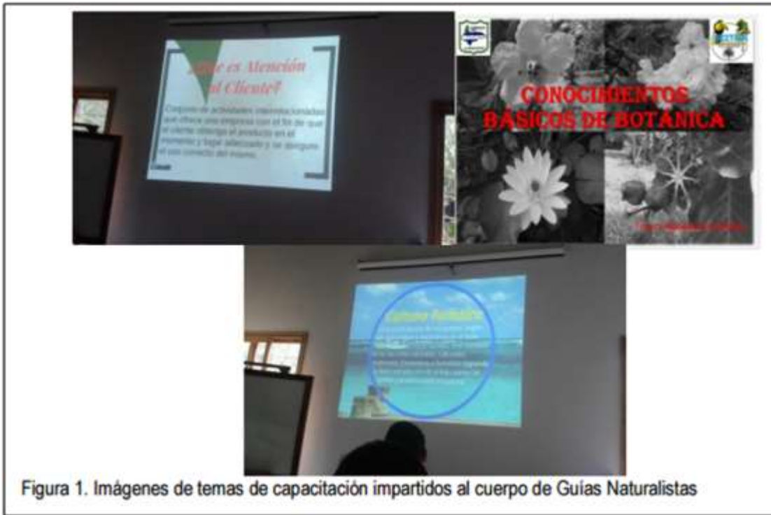
Figura 1. Imágenes de temas de capacitación impartidos al cuerpo de Guías Naturalistas