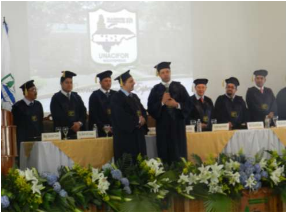
Ilustración 12: Actos de graduación de Dasónomos, Ingenieros Forestales y Máster en Estructuras Ambientales UNACIFOR 2016