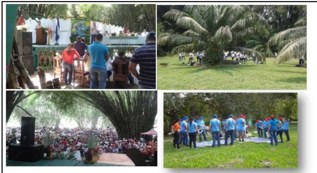
Figura 10. Imágenes de visitantes varios