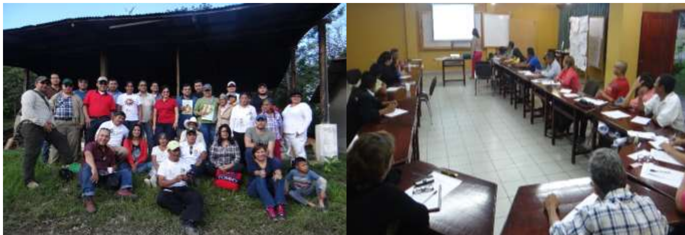
Ilustración 2: Evento sobre delitos forestales impartido por el Ministerio Público en coordinación con UNACIFOR y el ICF