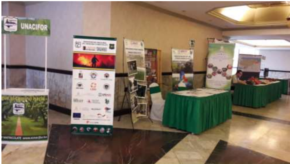
Ilustración 9: Conjunto de stand con información expuesto por diferentes Instituciones y Organizaciones en el V Simposium Internacional