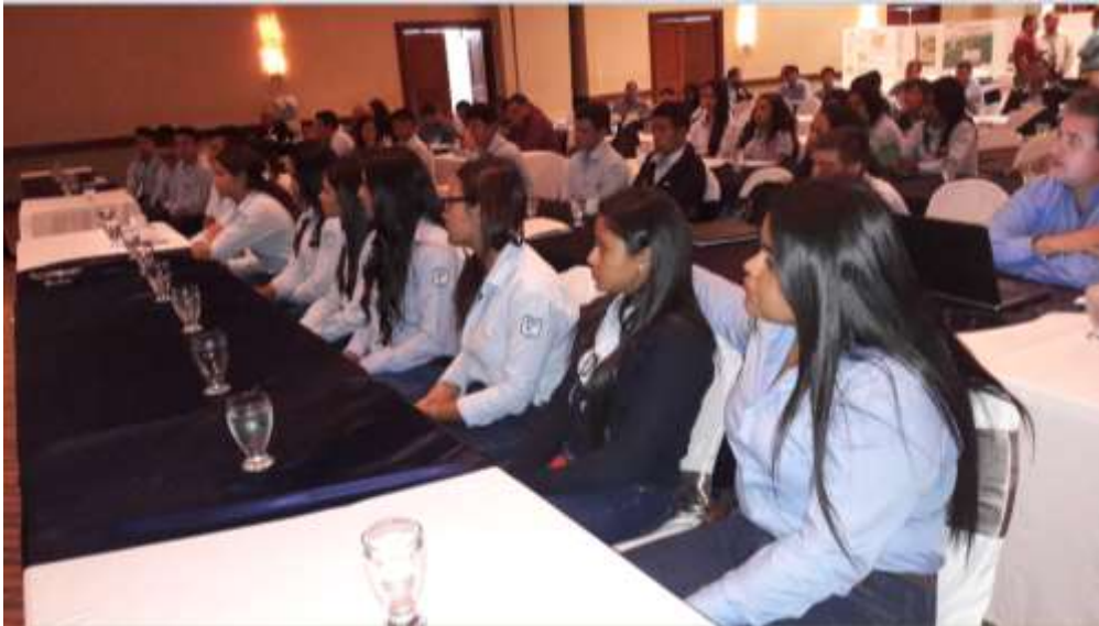
Ilustración 11: Participación de alumnos de la carrera de Dasonomía e Ingeniería Forestal en el V Simposium Internacional