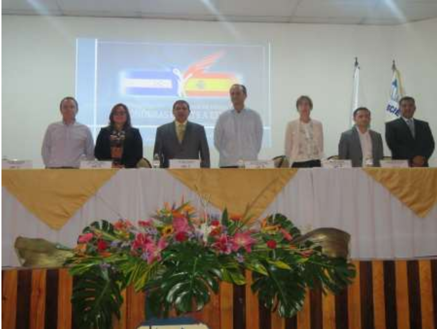
Ilustración 4: Firma de convenio de cooperación entre UNACIFOR y la Embajada de España junto al Banco Centroamericano de Integración Económica (BCIE)