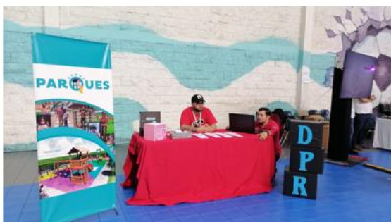
Participación XII Feria de Comités de Probidad y Ética 2024