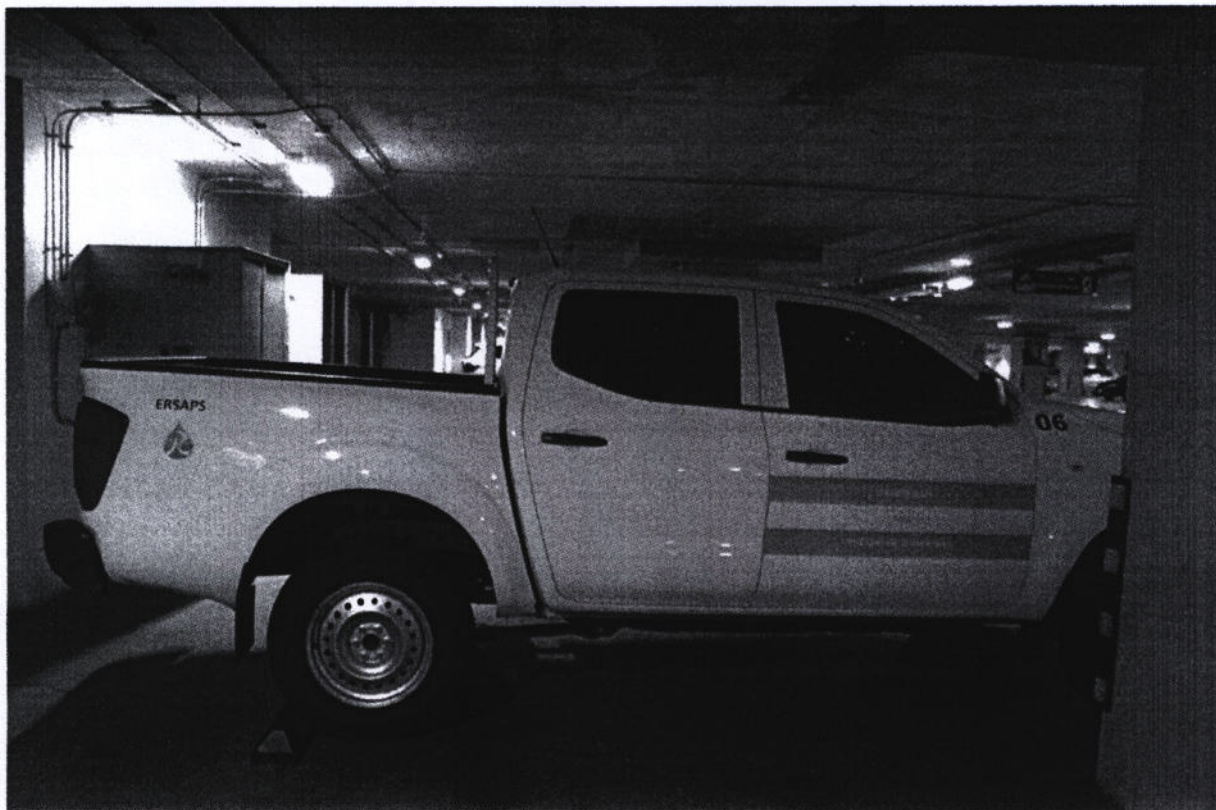
Polarizado Vidrio trasero