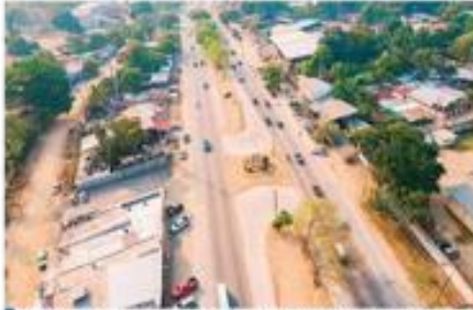
La obra inició con trabajos de topografía y terracería, en un tramo del bulevar a inmediaciones de Cemcol.

La última crítica, Contreras la recibió del ministro de Gobernación, Tomás Vaquerio, quien calificó de negligente al alcalde y su equipo financiero por no poder transmitir las transferencias del Gobierno. Antes lo había hecho el vicesaliente Omar Menjivá, con quien ha tenido marcadas diferencias desde el inicio de