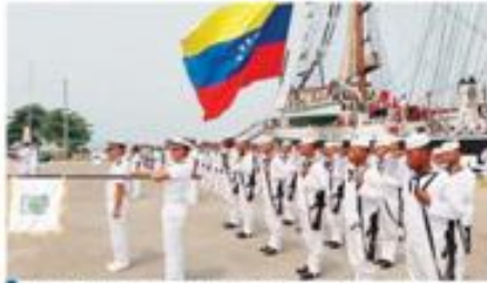
El Buque Escuela de Venezuela fue recibido con honores por los nuevos porteros.