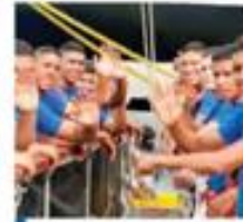
El Buque Escuela Simón Bolívar trae 70 cadetes a bordo.

atravesar en el puerto. La visita tiene como propósito continuar estrechando los lazos de cooperación entre Honduras y Venezuela y durante las 72 horas que dure su visita estará abierto al público en horario normal, según se explicó.