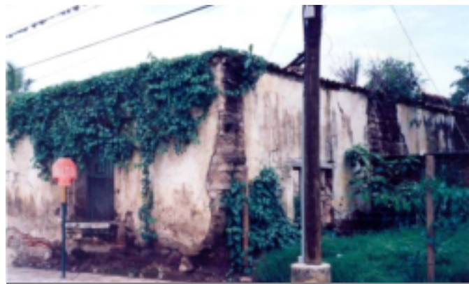
Edificio del Museo antes de su restauración