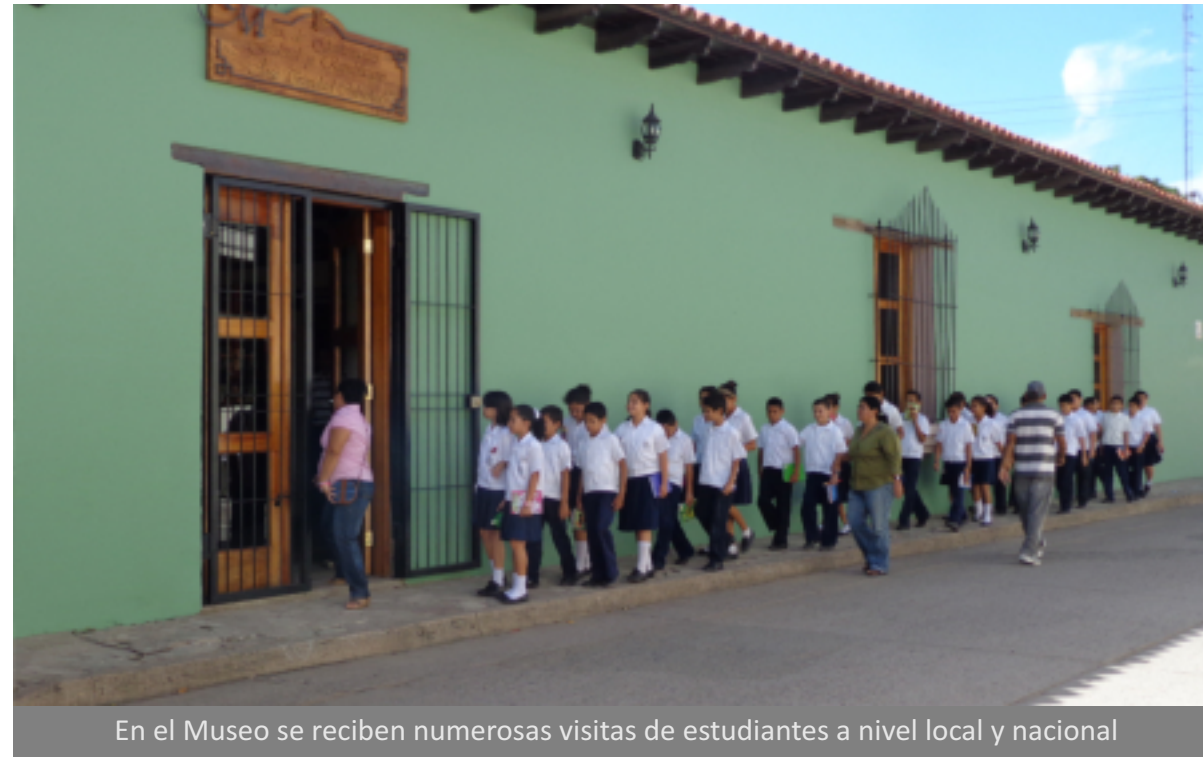
En el Museo se reciben numerosas visitas de estudiantes a nivel local y nacional