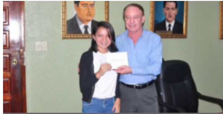
Los beneficiados del bono estudiantil son jóvenes de excelencia académica y bajos recursos económicos.

“En lo personal me siento agradecida con el Alcalde Carlos Miranda ya que siempre apoya a la educación y en este caso a nosotros que vamos a participar en las olimpiadas de matemáticas, sabemos que nos es nada fácil pero este tipo de ayuda nos fortalece y a la vez nos motiva para que obtengamos