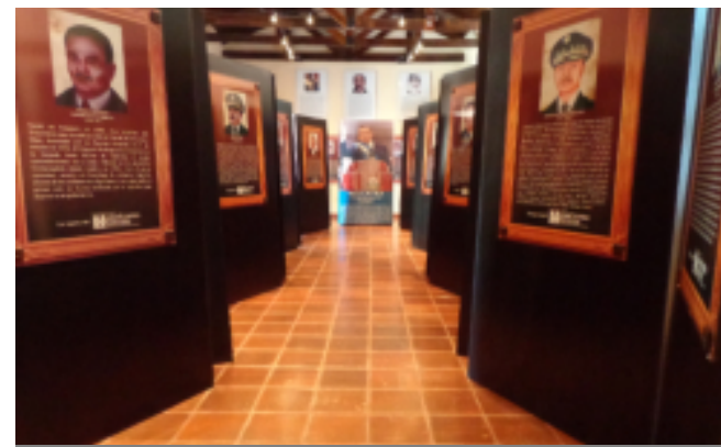
Sala Republicana II, “Ramón Rosa”.