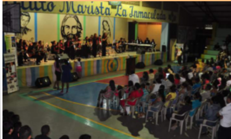
Este es el segundo concierto que lleva a cabo la Escuela Municipal de Música.

Con el objetivo de contribuir al fortalecimiento del arte y la cultura en el municipio de Comayagua, La Alcaldía de esta ciudad a través de la Escuela Municipal de Música realizó un sensacional concierto en el gimnasio del Instituto la Inmaculada.