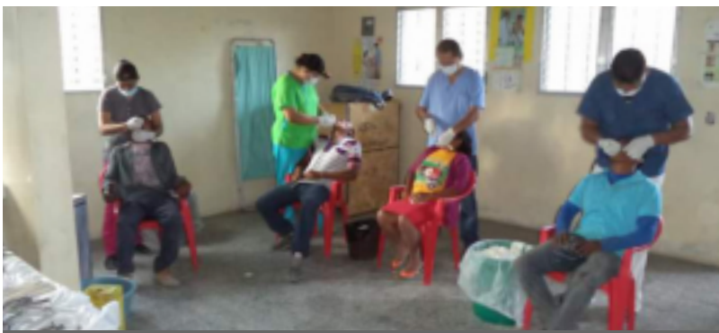
La Alcaldía Municipal invierte cada año alrededor de 5 millones de lempiras en brigadas médicas.

Cabe Mencionar que la alcaldía de Comayagua En los últimos meses ejecutó proyectos de pavimentación en los siguientes barrios: San Rafael, Suyapa, Lazos de Amistad, San Blas, Los Lirios, Fuerzas Armadas y Mejicapa.