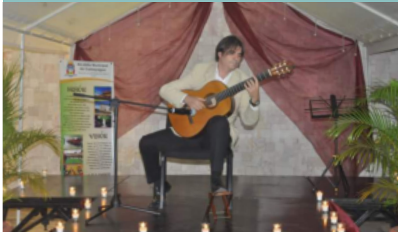
El concierto se realizó en el marco de la celebración del Día de España o Día de la Raza.