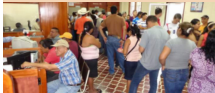
La Amnistía Tributaria tendrá vigencia hasta el 29 de diciembre.