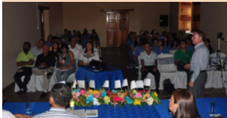
Los estudiantes conocieron sobre el proceso de desarrollo integral sostenible de Comayagua.