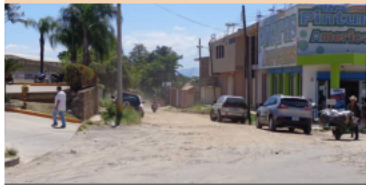
Este proyecto tendrá un costo de 1 millón de lempiras.