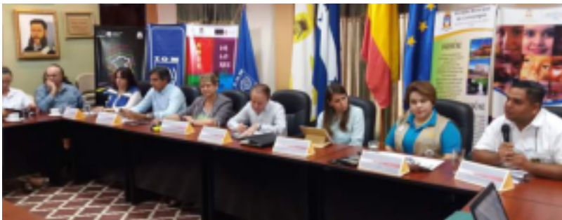
Las autoridades se comprometieron a trabajar arduamente en el tema de migración.

Sin embargo, por cualquier circunstancia los ciudadanos no pudieran cancelar los impuestos en su totalidad, pueden avocarse a las oficinas de Administración Tributaria de esta alcaldía y hacer un plan de pago para cancelarlo durante el periodo de la Amnistía.