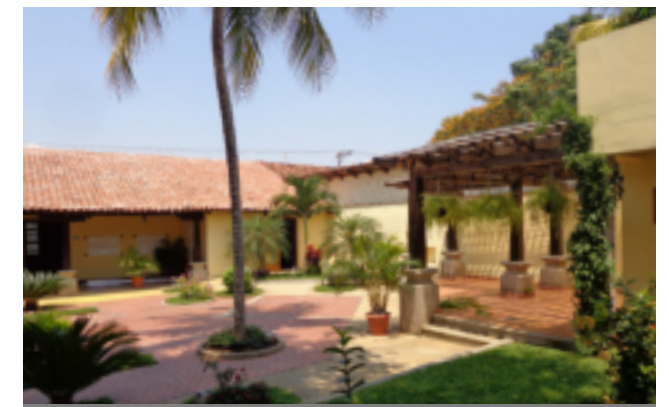
Vista frontal del jardín central del Museo.

Comayagua, una ciudad para vivir, visitar e invertir.