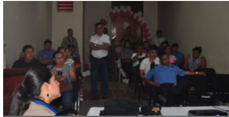
Las personas que se dedican a la venta de pólvora deben seguir los parámetros de venta establecidos legalmente.

Además, manifestó que la Ley de Control de Armas, Municiones y Explosivos establece una multa de 1 a 10 salarios mínimos a las personas que infrinjan la ordenanza