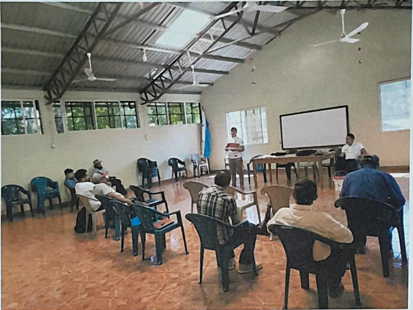
Reunión propuesta de relleno sanitario