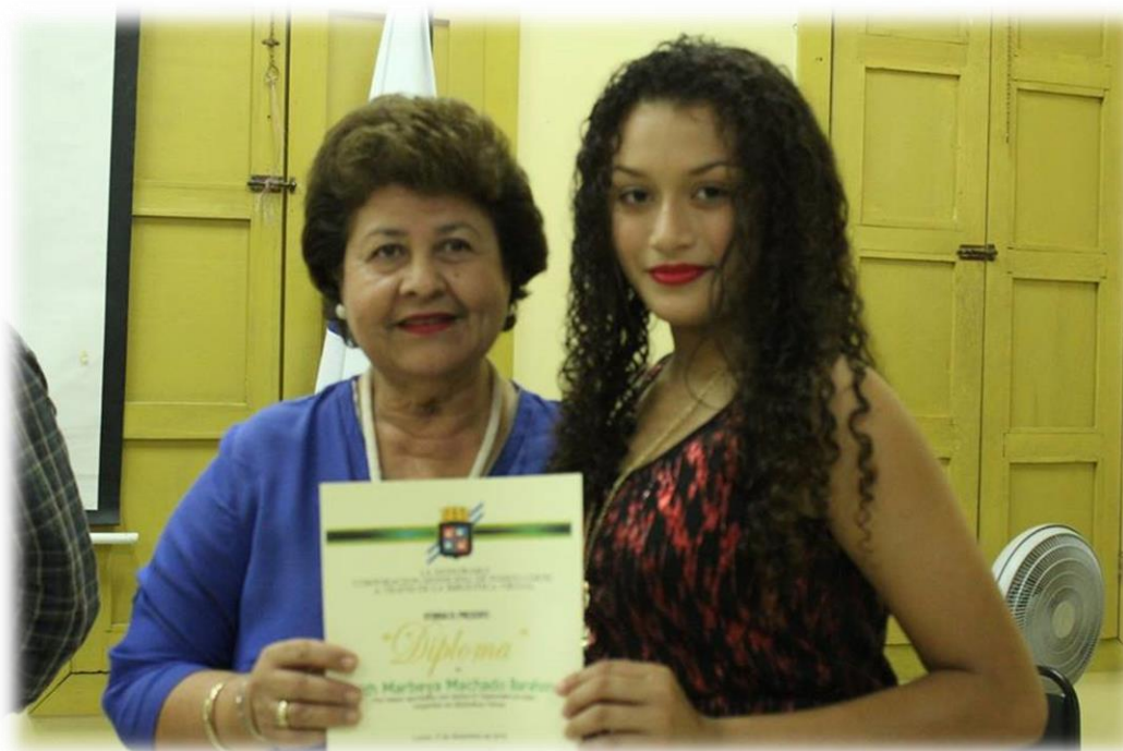
3 Clausura Diplomado de Ingles