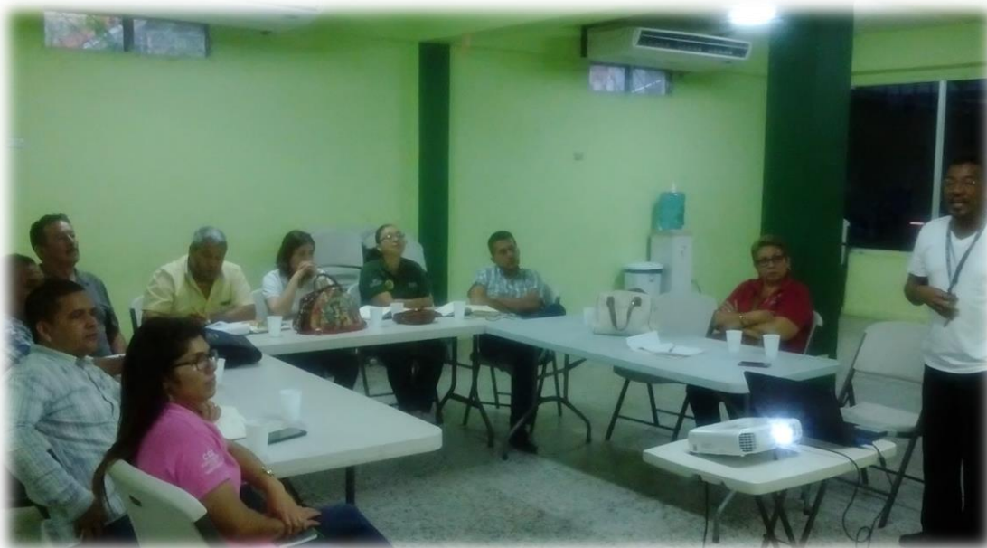
1 Reunion con las Cooperativas