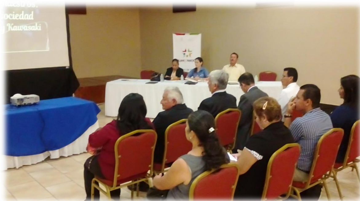
2 Premiacion al maestro del año