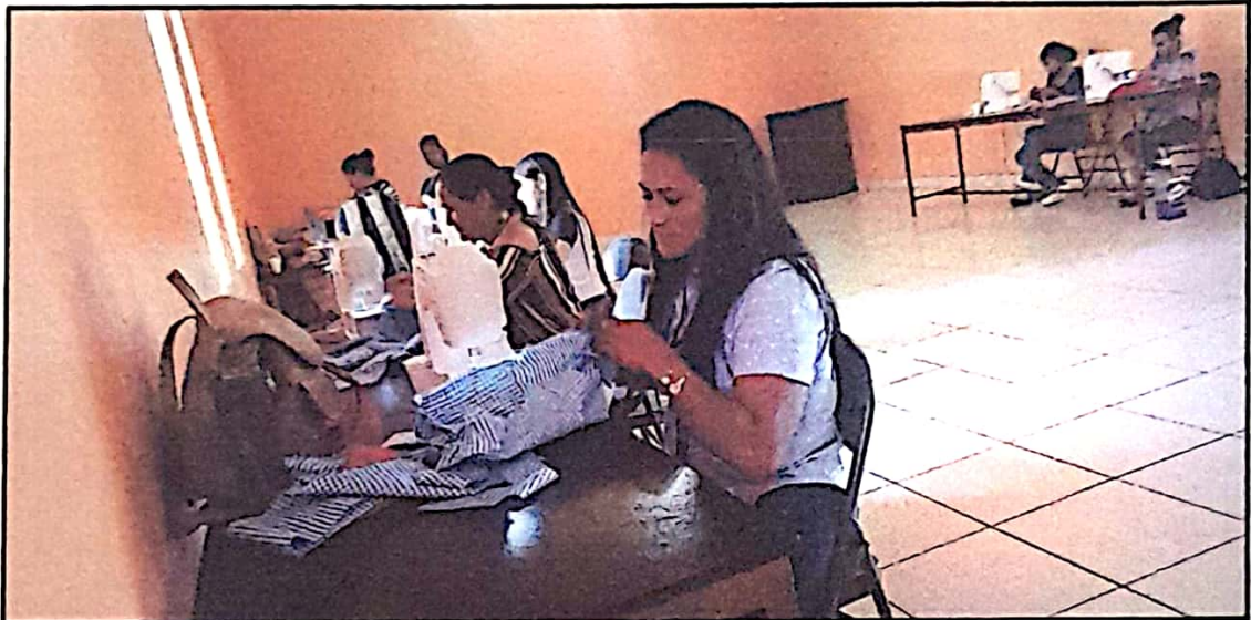
Primer resultado delantal confeccionado