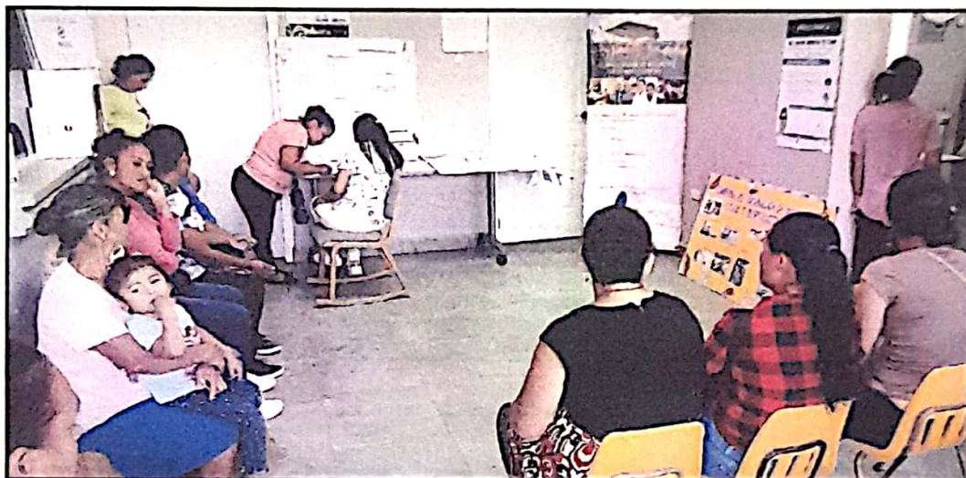
Desarrollo de Jornada de Citologías en el casco urbano del municipio