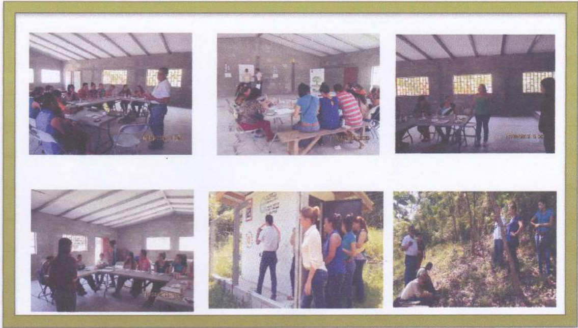
4. Jornada de Capacitación a Mujeres y Jóvenes en el tema de Calidad de Agua y medición de cloro Residual, impartido por el personal técnico del Lab. Municipal Ambiental "22 de Marzo".