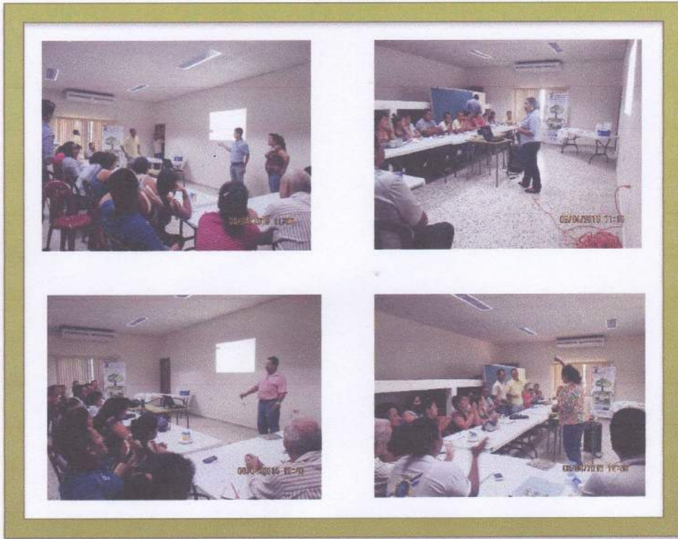
2. Visita al Laboratorio en jornada de capacitación a Juntas de Agua y Saneamiento del Sector Pantano.