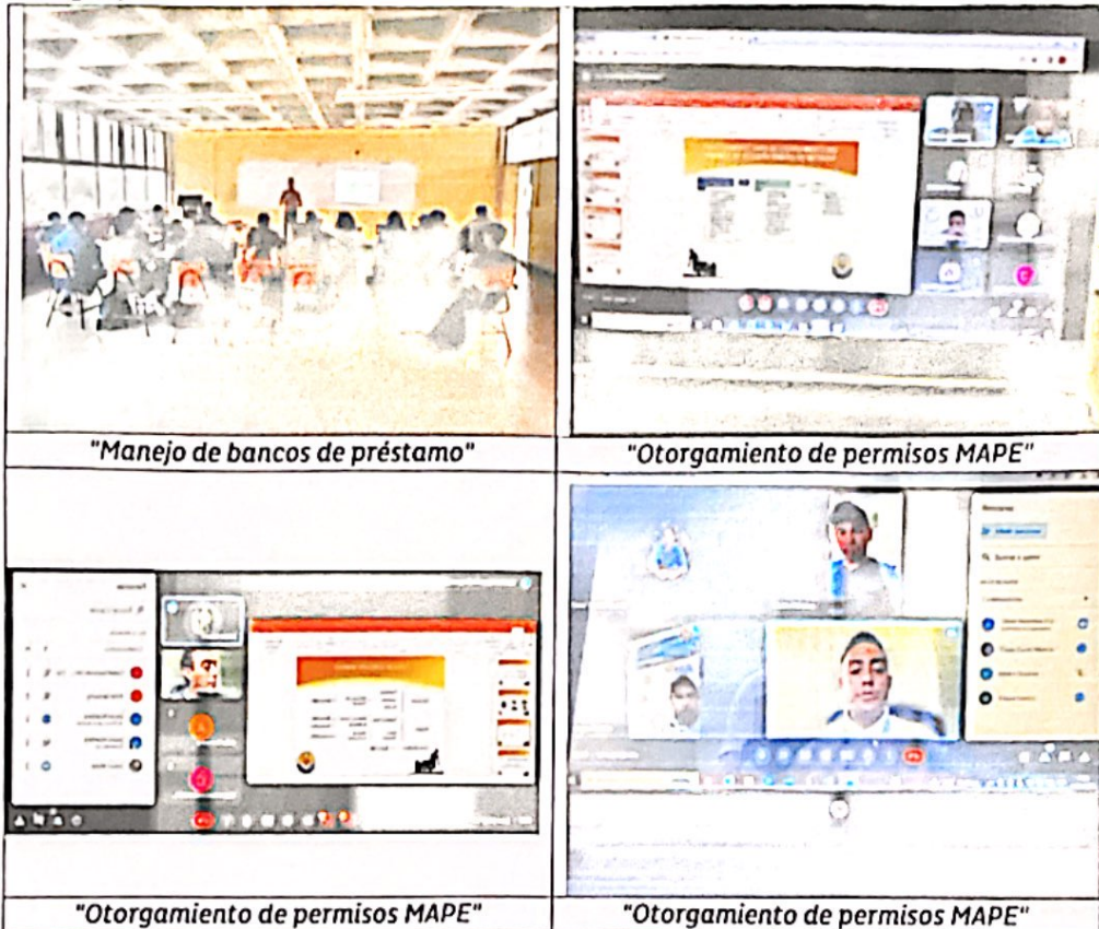
"Manejo de bancos de préstamo"