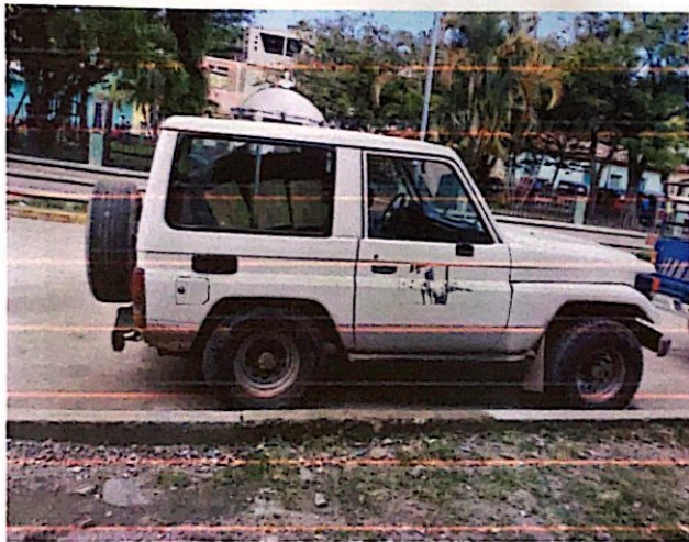
Land cruiser jeep color Blanco