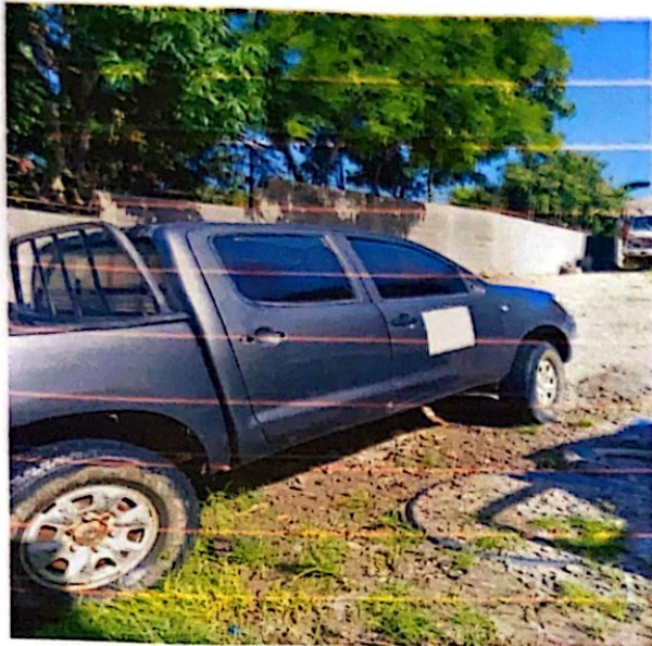
HILUX COLOR GRIS