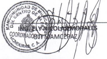
MAURO MORALES BONILLA COMISION EVALUADORA