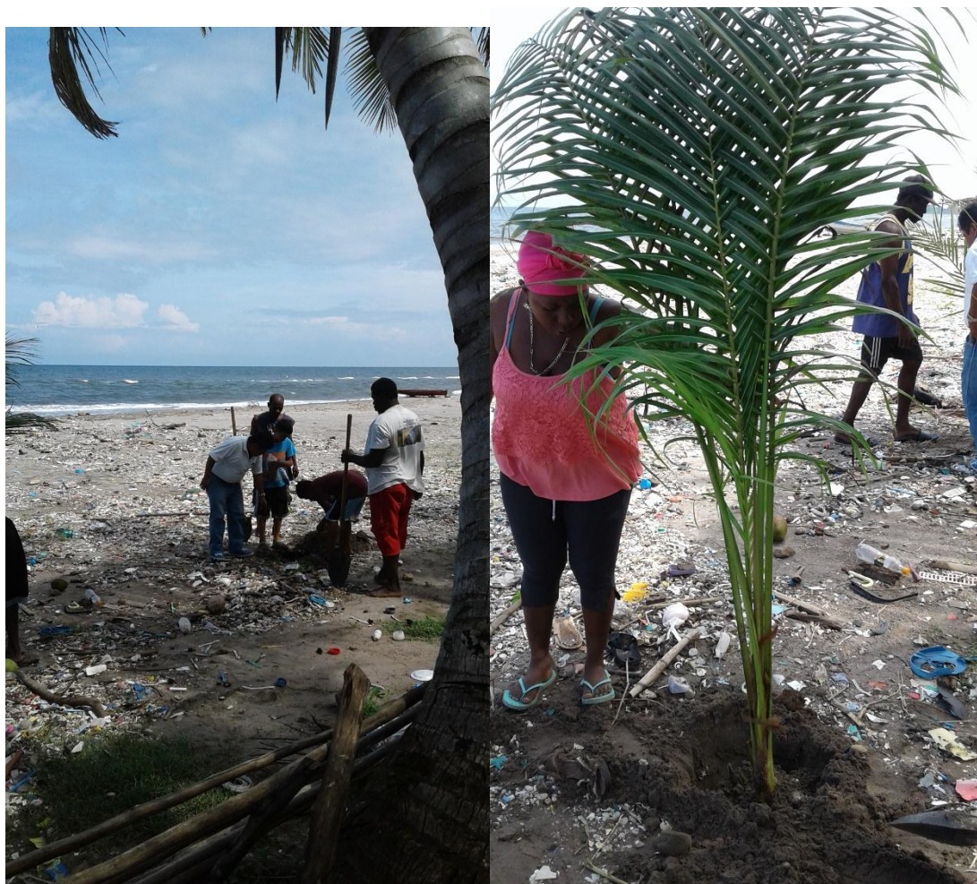
Ilustración 1 Siembra de Plantas de cocos