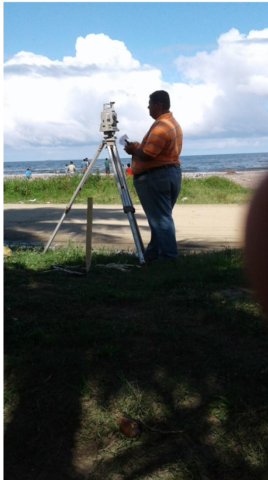
Ilustración 4 Medición para construcción Quioscos Turísticos