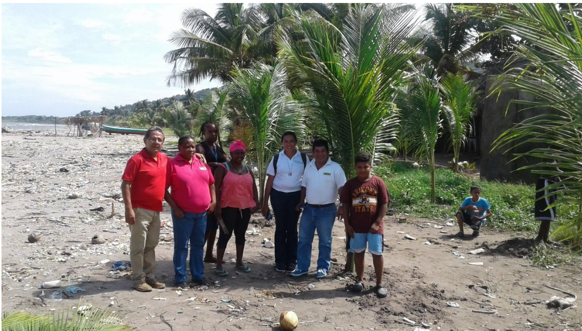
Ilustración 3 Acompañantes SAG