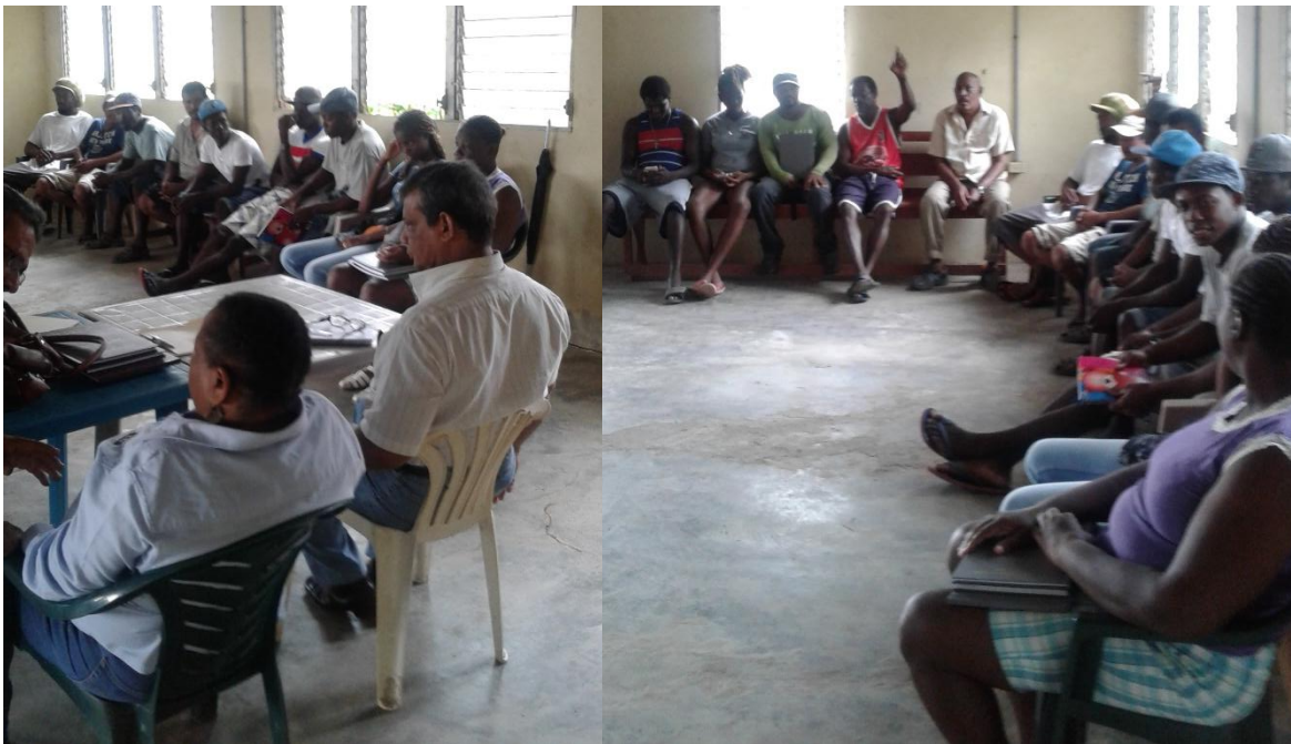
Ilustración 5 Reunión caja rural pescadores y caja rural turismo