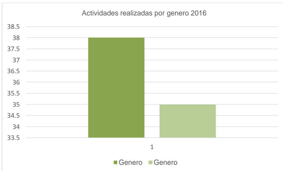
Grafico 2 Actividades realizadas por genero 2016