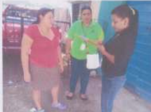
LISTADO DE NOMBRES DE FAMILIAS DE LA COMUNIDAD DE SAN JUAN DE LOS RIOS