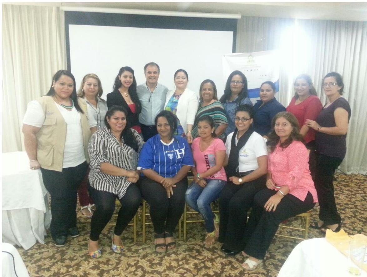
Ilustración 3. Taller realizado por ONUSIDA a coordinadoras OMM

Taller realizado por ONUSIDA de la Ciudad de San Pedro Sula a coordinadoras de las OMM.