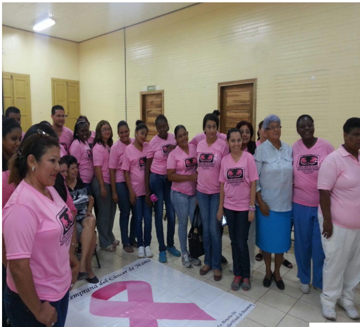
Ilustración 1. Clausura campaña de Prevención de lucha contra el Cáncer de Mam:

1.8 Apoyo Establecimiento salud “ Cornelio Moncada ”, en la campaña prevención lucha contra el cáncer de mama.