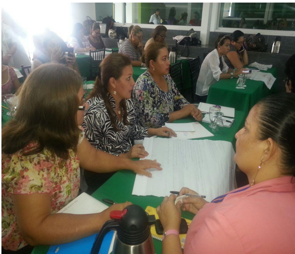
Ilustración 4. Taller a Coordinadoras OMM

Taller realizando en la Ciudad de San Pedro Sula, encuentros de Coordinadoras de las Oficinas Municipales de la Mujer (OMM).