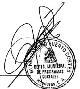
Ilustración 1 Listado asistencia en oficina