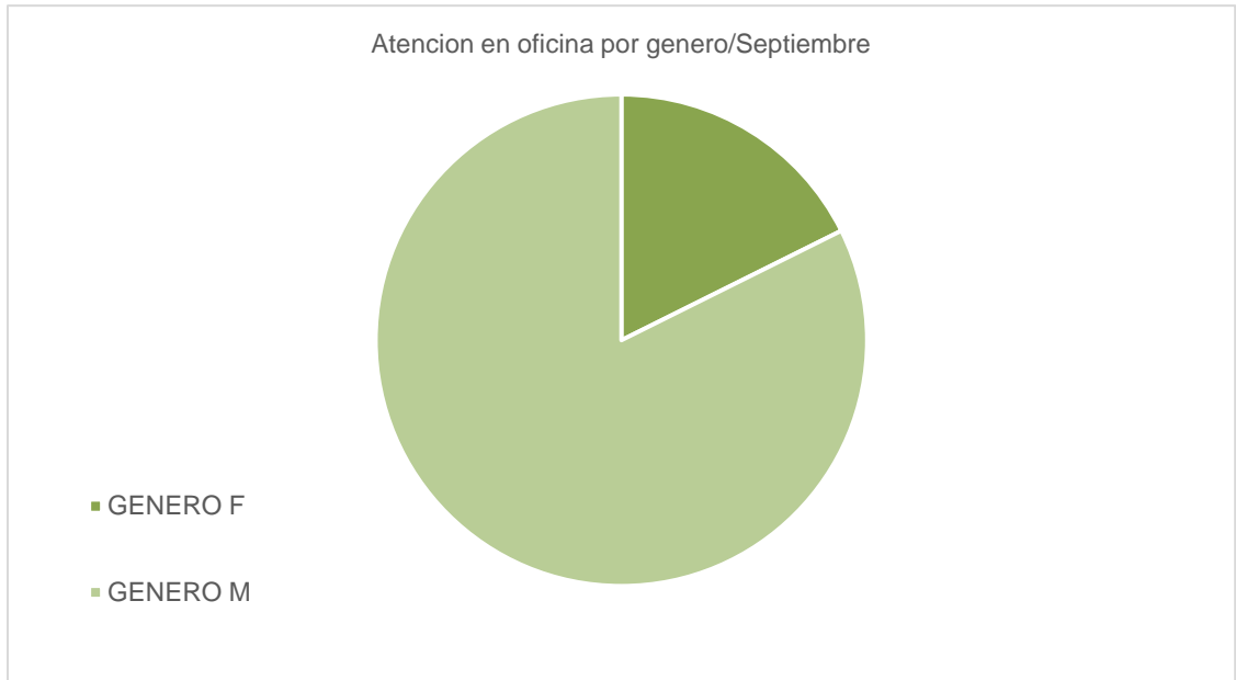
Grafico 3 Atencion en oficina por género