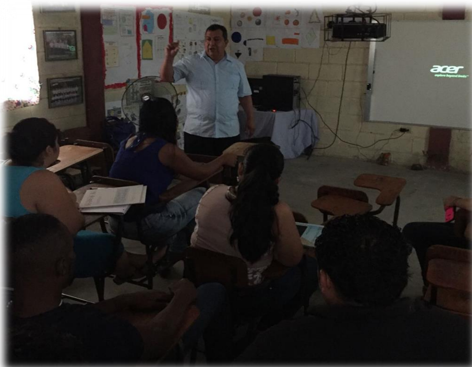
1 Reunion con maestros para impartir clases de Ingles