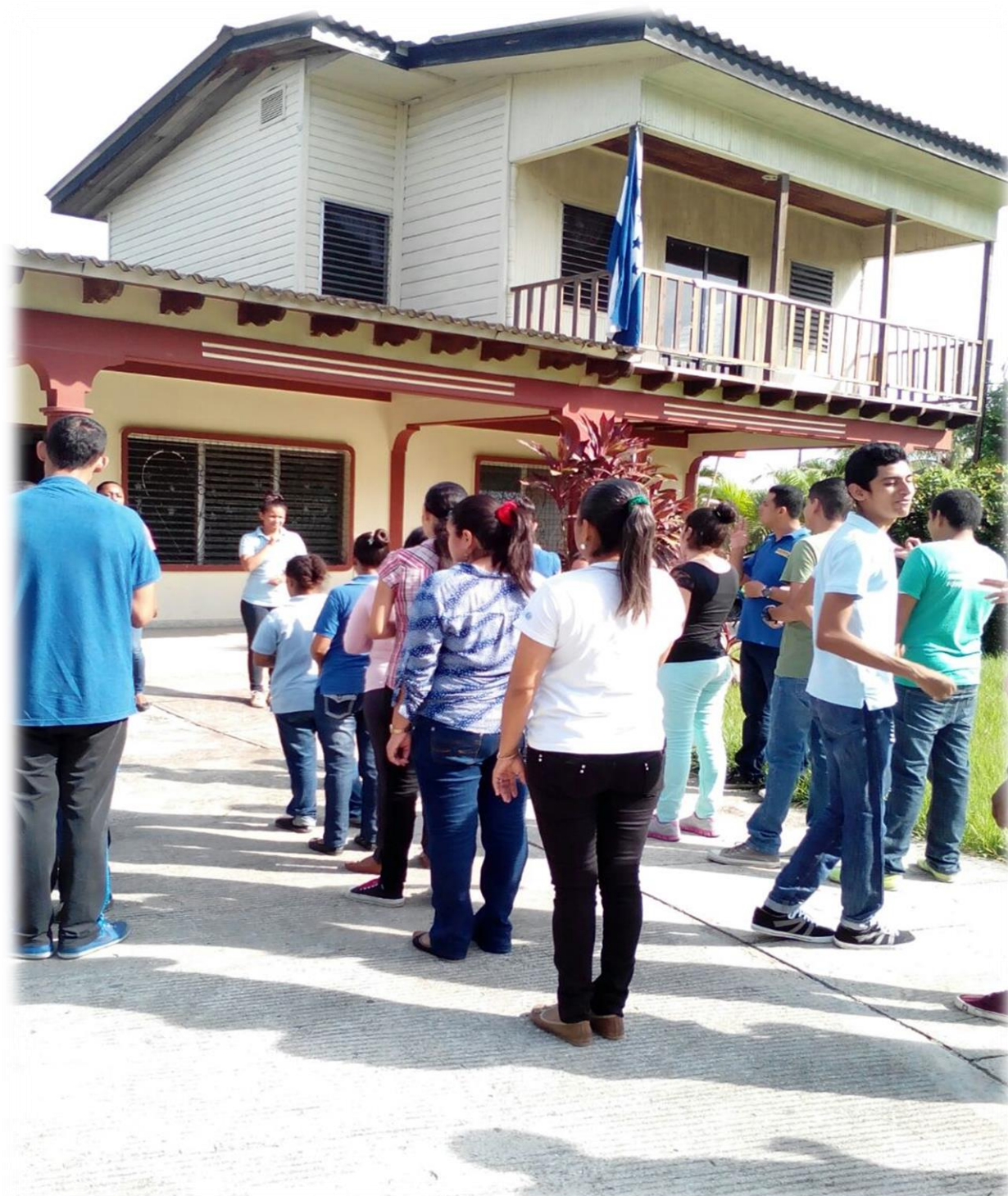
2 Inauguración de clases Escuela Especial Emanuel