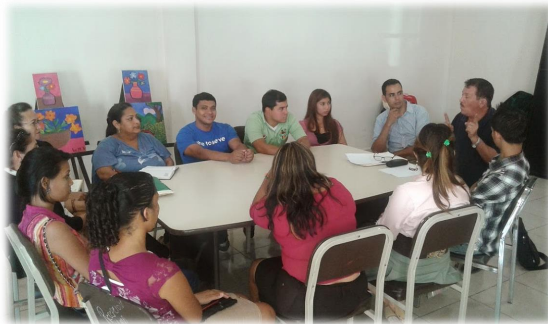
3 Reunion con maestros aspirante a impartir clases de Tecno Ingles