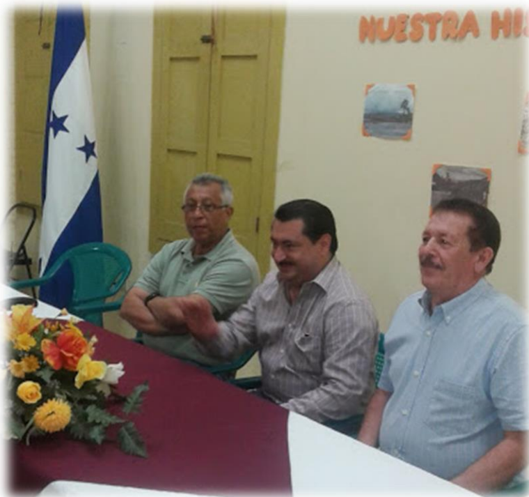
1 Conversatorio Quien sabe mas de nuestra historia