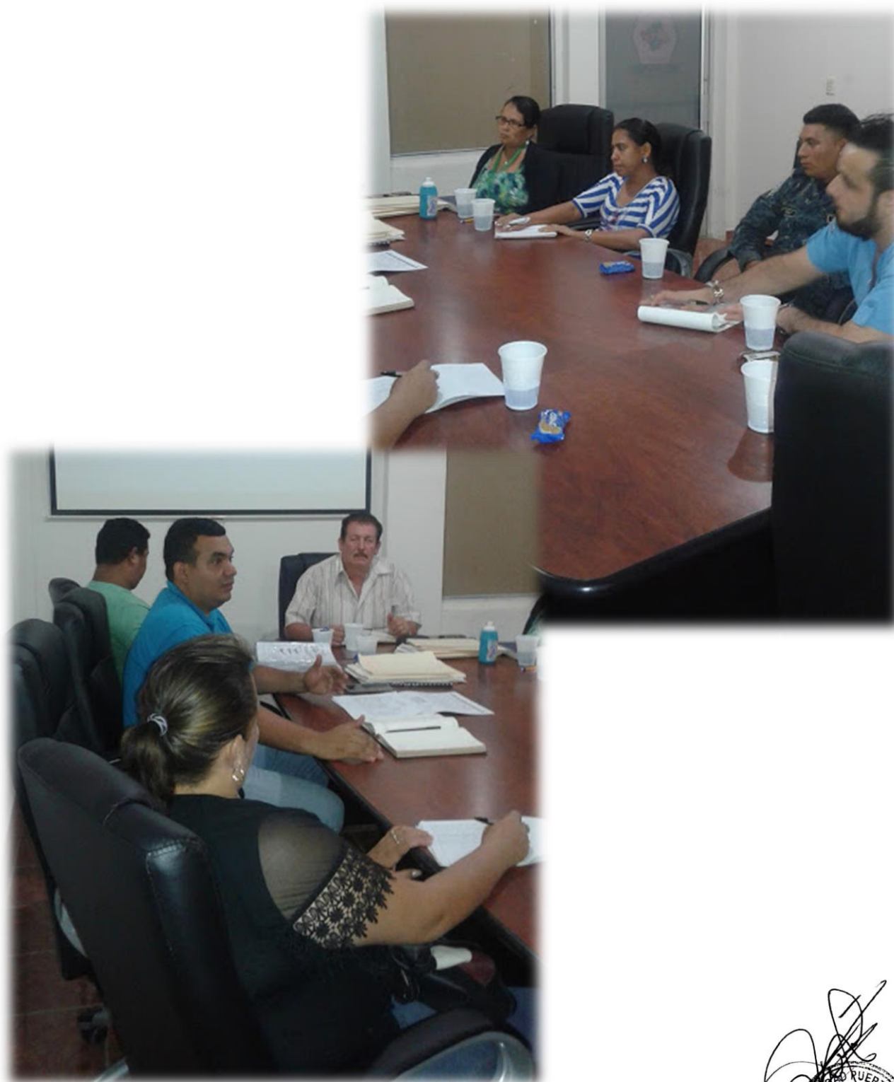
2 Reunion Cordinadores IHER