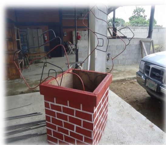
3 Elaboración de decoraciones para Navidad Dorada