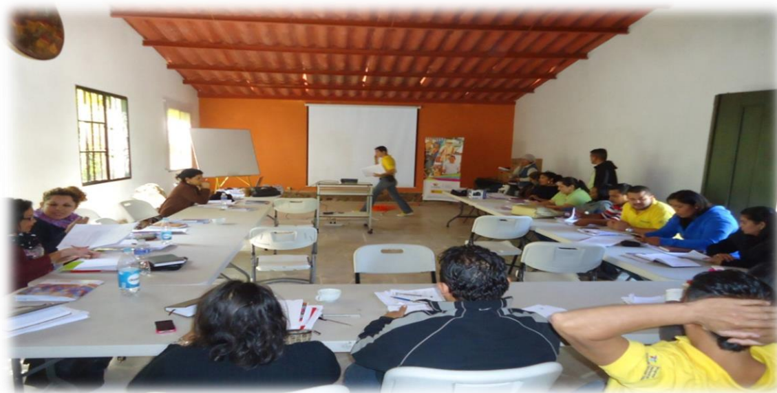
2 Capacitación en Taller en Institucion basads en competencias ET