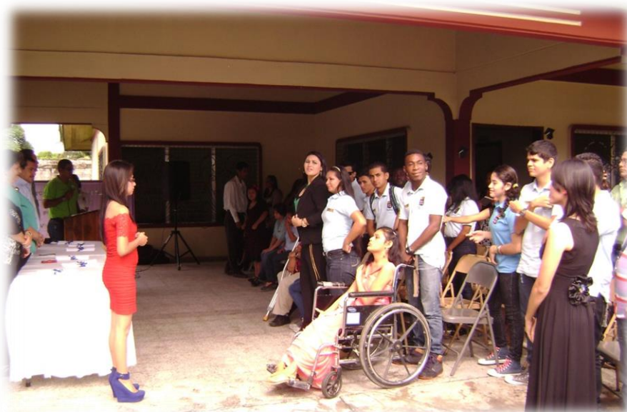
1 Clausura alumnos de la Escuela Especial Emanuel