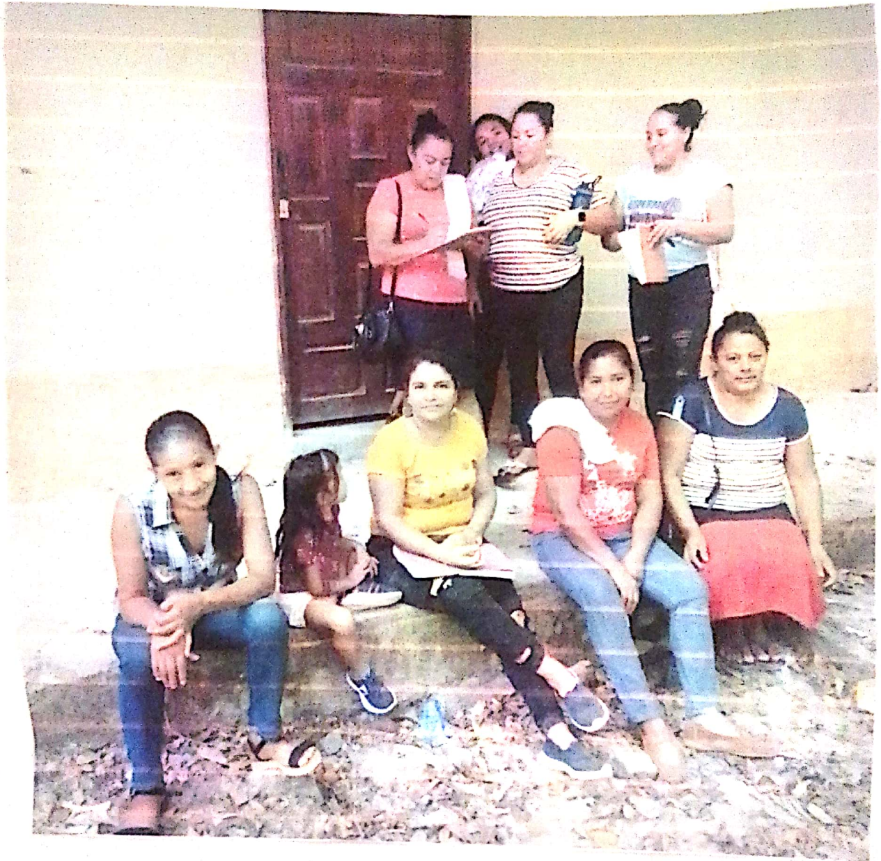
REUNION CON GRUPO ORGANIZADO "NUEVO AMANECER" EL RODEO