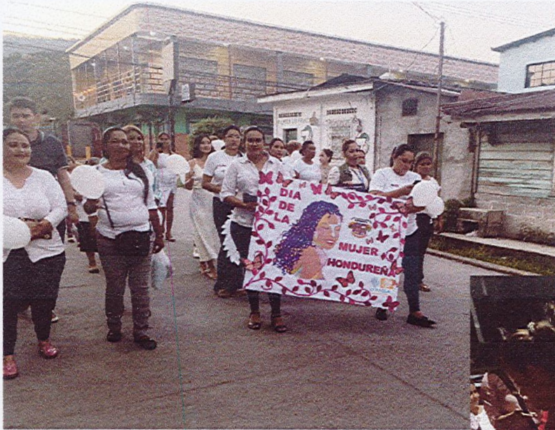
Caminata en conmemoración en día de la mujer hondureña

Programa Municipal de Infancia Adolescencia y Juventud COMVIDA Potrerillos, Cortés