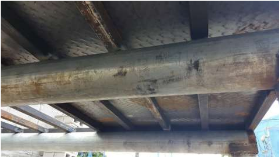
Avances de construcción de bodega mini posta y bases para instalación de tanques de almacenamiento de agua