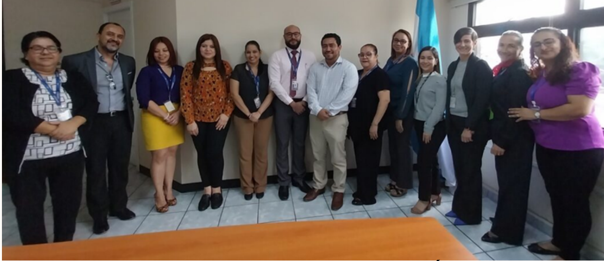
Representantes de TSC, Director Especialista, Comité de Ética, Comité Adjunto.