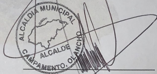
Marco Aurelio Soto Turcios Alcalde Municipal