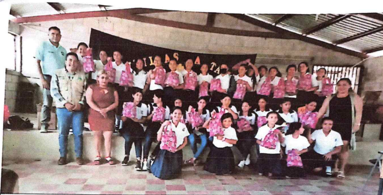
Figura 3. Foto Grupal con las señoritas que participaron en el taller.

Y para constancia se adjunta la Agenda del Evento y los Listados de asistencia.