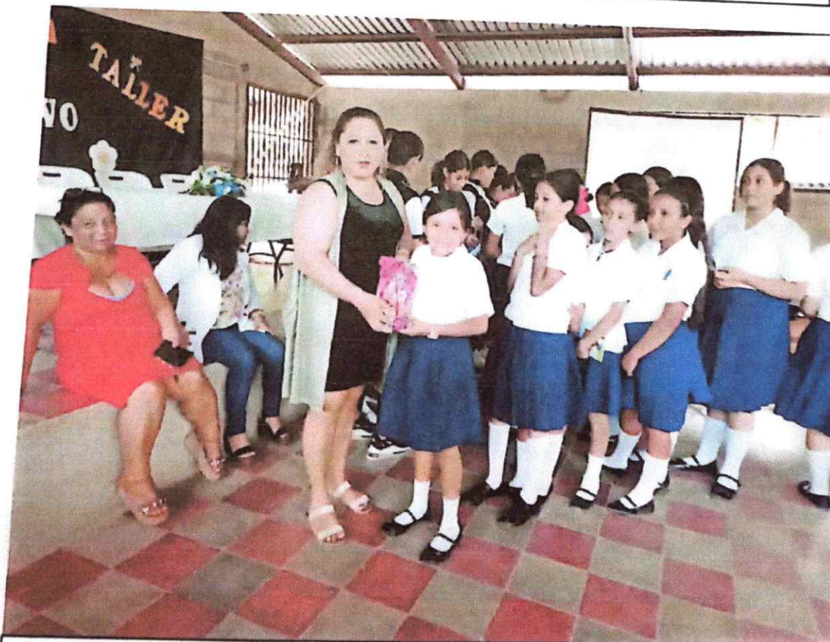
Figura 2. Entrega de Kits por la coordinadora de la OMM