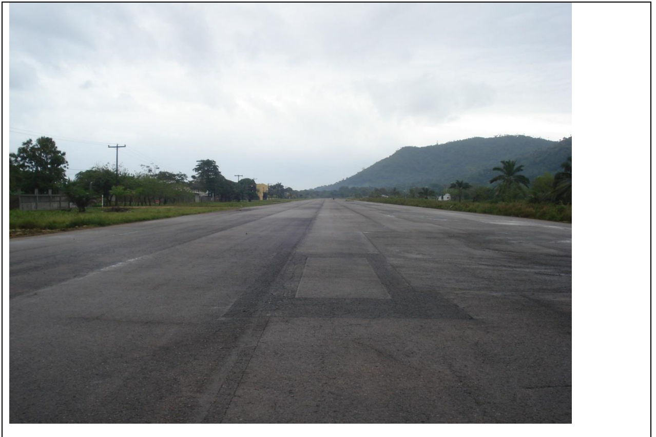
5. Supervisión de la construcción del Edificio Terminal del Aeródromo de puerto Lempira.