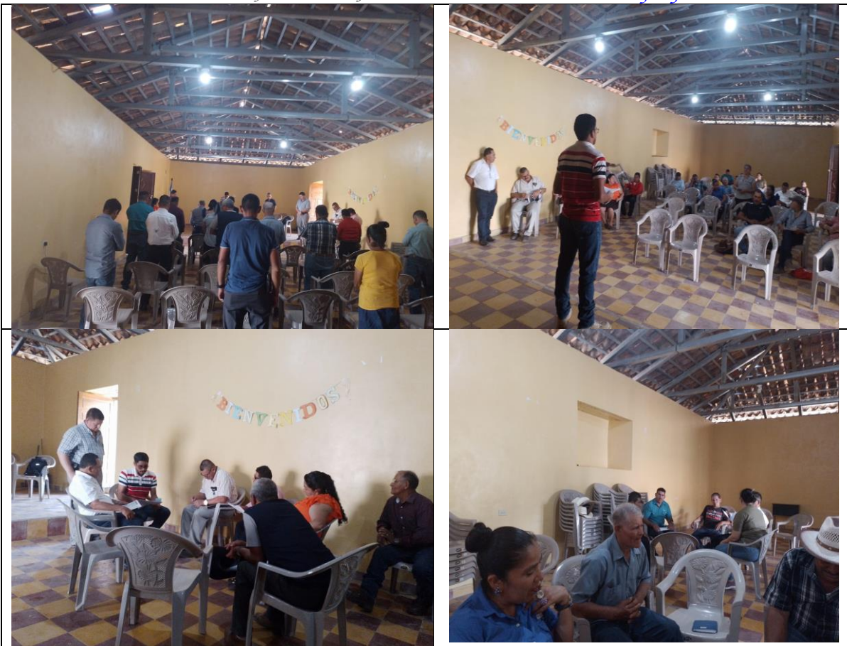
Evaluación del PDM ZONAL el Centro, comunidad de Tablones, San Lucas, Gelpoa y Concordia

Barrio el Centro San Francisco, Lempira Honduras C.A. Correo munisanf@yahoo.es