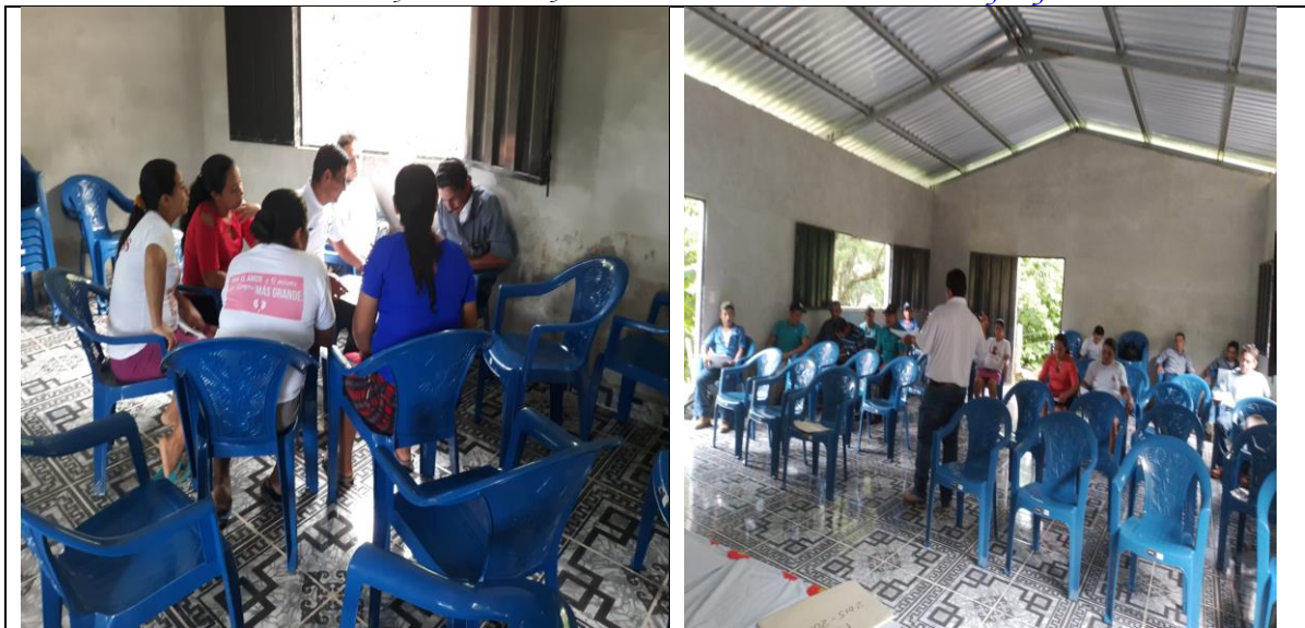
Reunion zonal para evaluacion del PDM comunidad de las Anonas, las Aradas, Rorruca y la Ceibita

Barrio el Centro San Francisco, Lempira Honduras C.A. Correo munisanf@yahoo.es