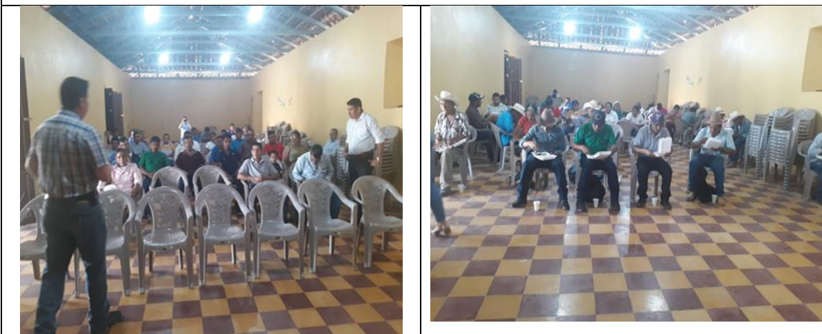
Reunion con grupo Zonal para la evaluación del PDM con las comunidades de Magdalena, Las Cuevas, Guanijquil y las Marias