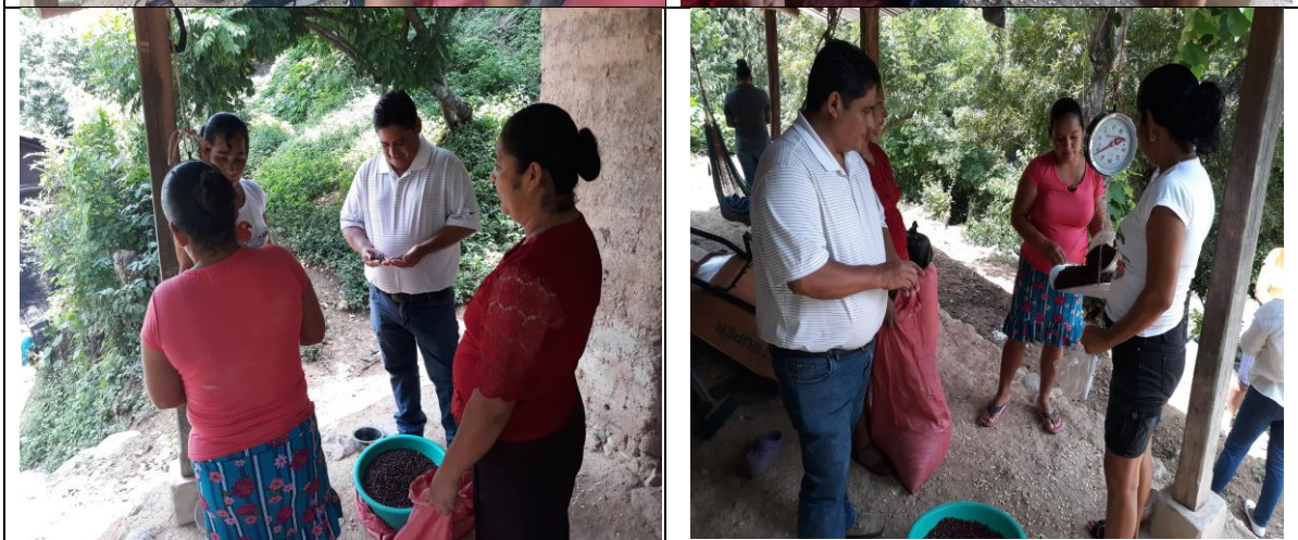
Reunion con grupo organizado de la reserva de granos para identificar abances del