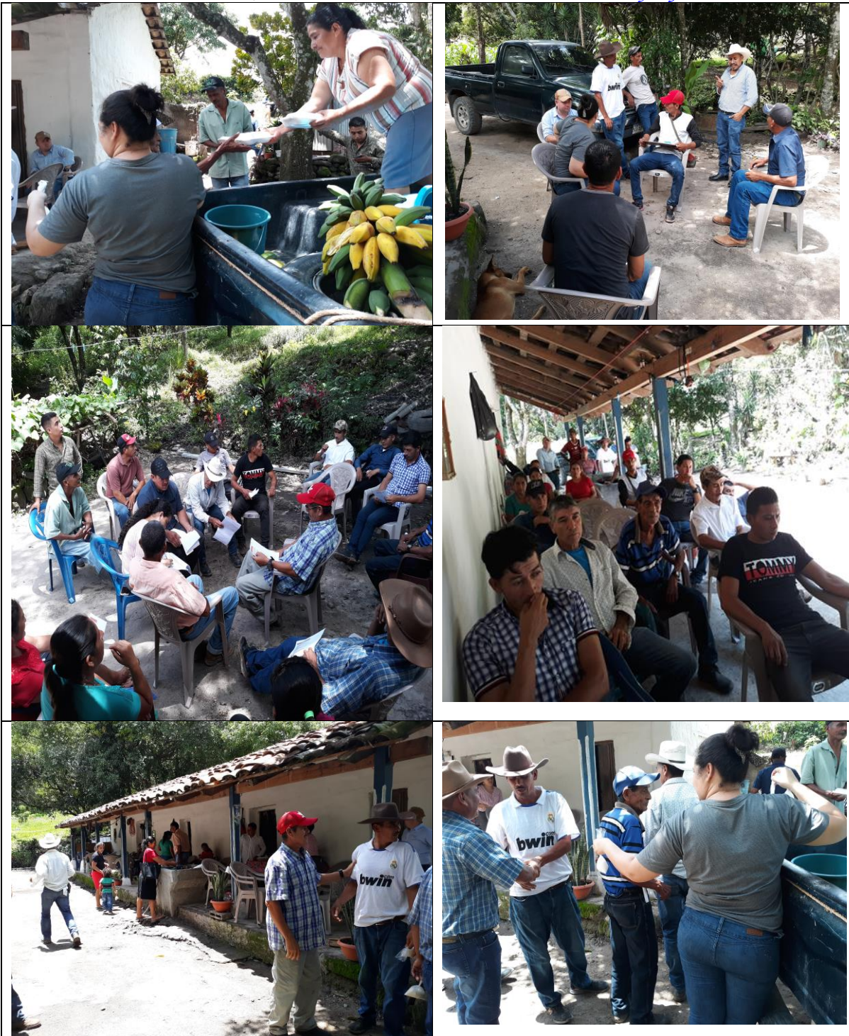
Reunion zonal para evaluacion del PDM Maiquira y las Flores con diferentes lideres comunitarios

Barrio el Centro San Francisco, Lempira Honduras C.A. Correo munisanf@yahoo.es