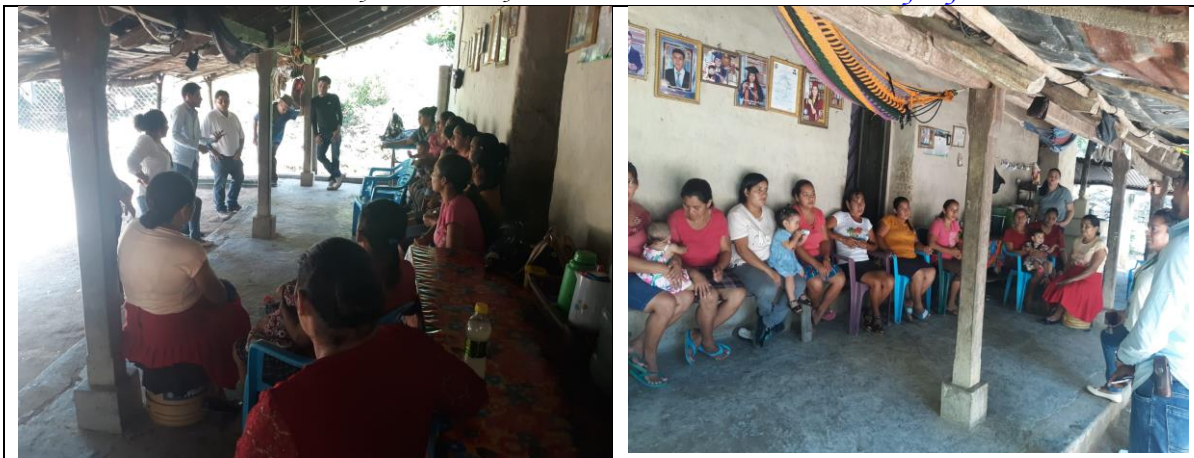
Reunion con grupo organizado de la comunidad de las Marias con la institucion GOAL para el levantamiento de informacion relacionado con necesidades basicas de la comunidad con relacion a la sequia proveniente del corredor seco.

Barrio el Centro San Francisco, Lempira Honduras C.A. Correo munisanf@yahoo.es