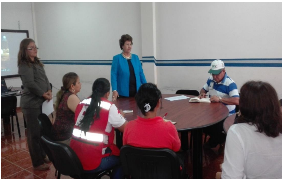
Ilustración 3. Reunión para Validación Protocolo Casa Refugio Puerto Cortés