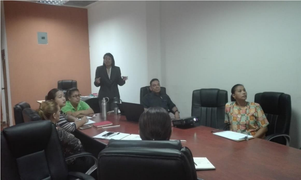
Ilustración 1 . Capacitación II Modulo Personal Idóneo y II Modulo Técnicas y Estrategias de Liderazgo