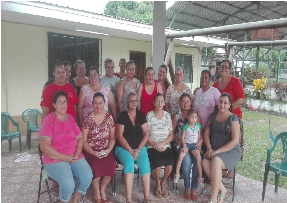
Ilustración 2. Elección de Juntas Directivas de Red de Mujeres en diferentes comunidades del Municipio de Puerto Cortés