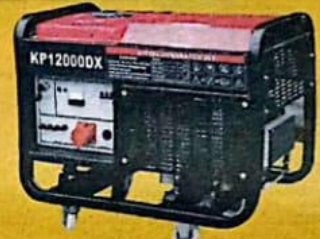
HDKP12000DX - GENERADOR 12KW SALIDA DC 12V 3A 120-240V 60HZ DIESEL 1HP TANQUE 25L