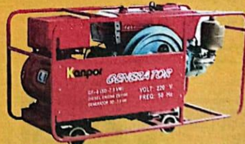
HDGF115 - GENERADOR MONOFASICO 125KW 15KVA 120 - 240V 1500RPM 60HZ 4 CICLOS