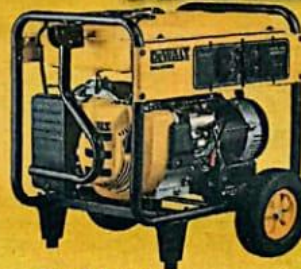
DXGN14000 14000W 11700W CONTINUO / GASOLINA

tenemos LO MEJOR en Generadores Eléctricos