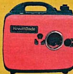
HDBS2000 - GENERADOR 1.8KW SALIDA DC 12V 8.3A 120V 60HZ TANQUE 4L