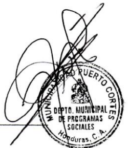
Grafico 1 Listado de Asistencia Curso Básico