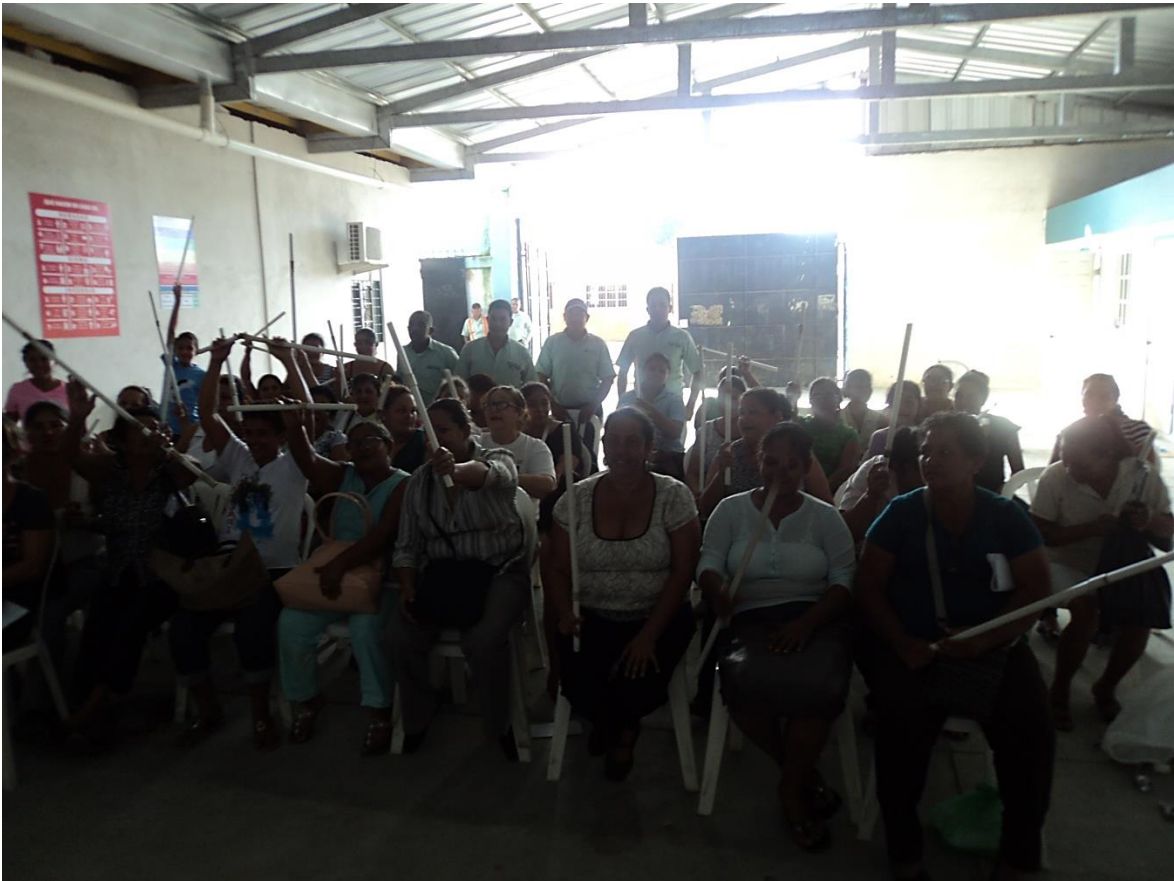
Ilustración 2 Asistencia de Beneficiarias