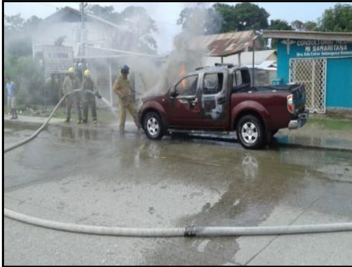
Actividad : Extincion de Incendio en Vehiculo Lugar: Puerto Cortes, Barrio el Porvenir,cruce carretera a Omoa Fecha: 07/01/2016