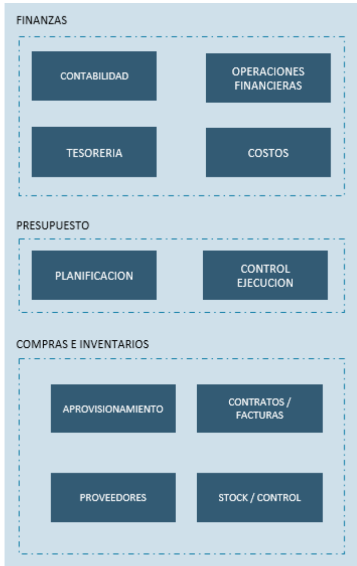
Ilustración 2. ERP

Lo anterior, sin perjuicio de cualquier otros que el Prestador de Servicios considere necesarios como parte de la solución ofrecida para la ejecución de los Servicios.