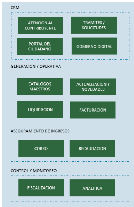
Ilustración 1. CMR y Generación y operativa