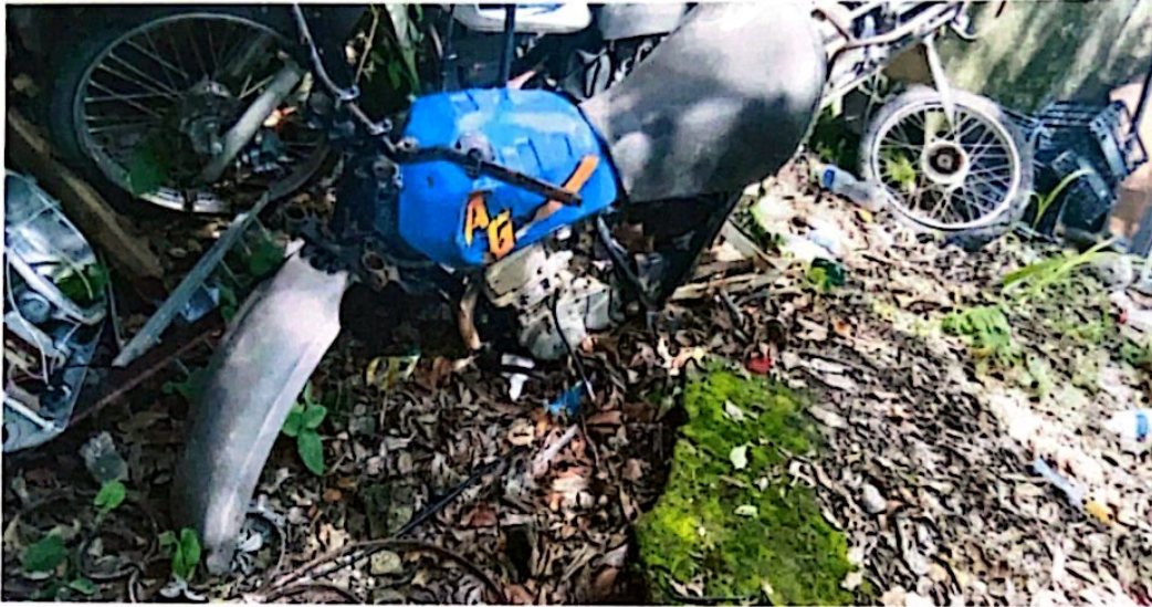
Motocicleta A G 200 YAMAHA