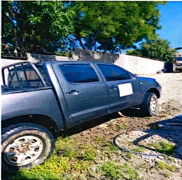
HILUX COLOR GRIS