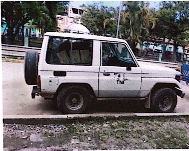
Land cruiser jeep color Blanco