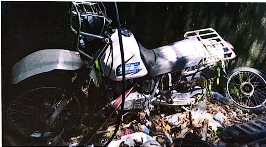
Motocicleta Suzuki 200