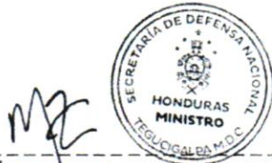
ABOGADO JOSÉ MANUEL ZELAYA ROSALES SECRETARIO DE ESTADO EN EL DESPACHO DE DEFENSA NACIONAL