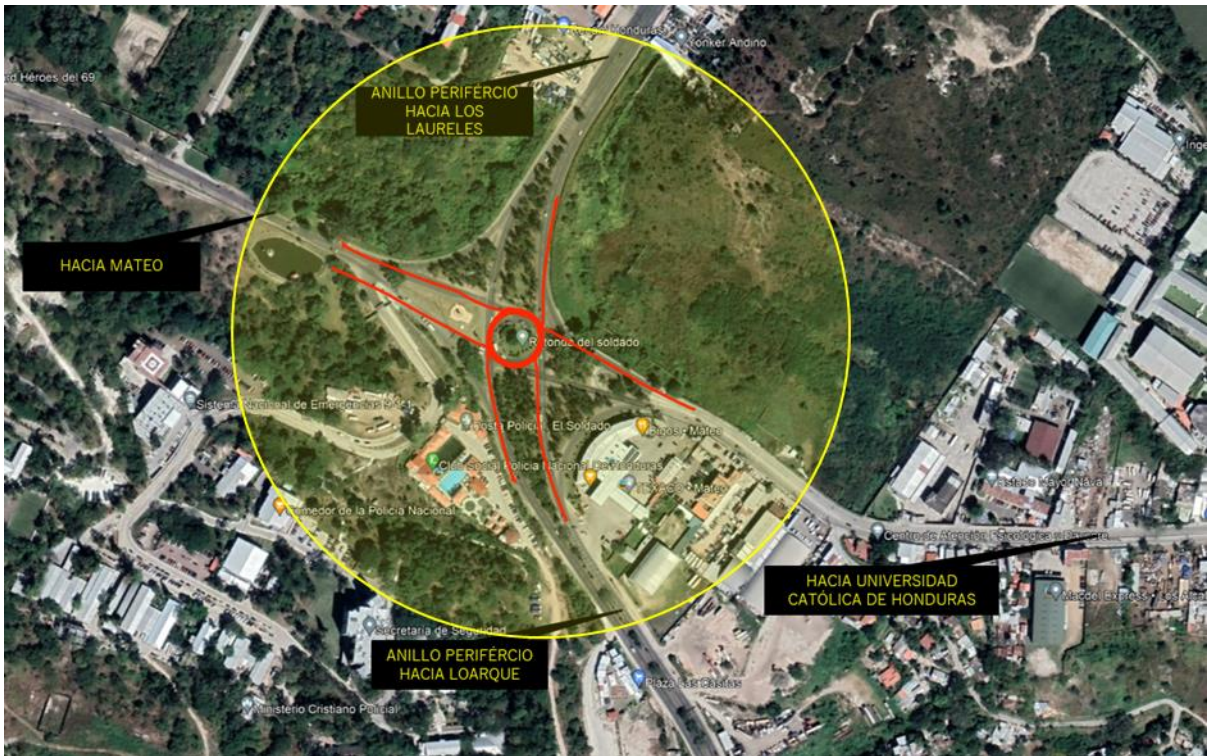
Ilustración 1: área de intervención del proyecto