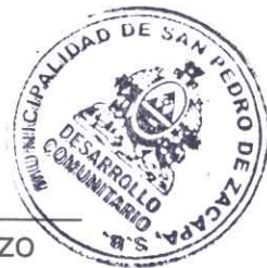
Iris Rosinda Castellanos Erazo Desarrollo Municipal Comisión de Evaluación