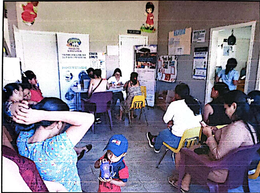
Participación en Capacitación organizada por GLH USAID