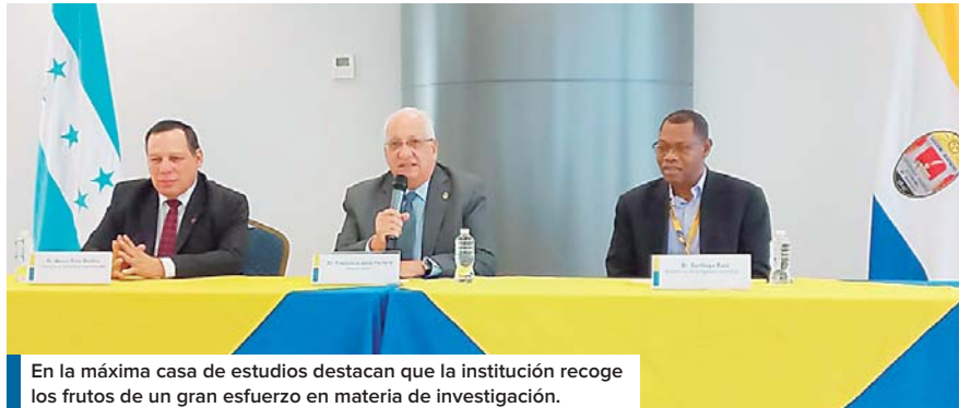
En la máxima casa de estudios destacan que la institución recoge los frutos de un gran esfuerzo en materia de investigación.