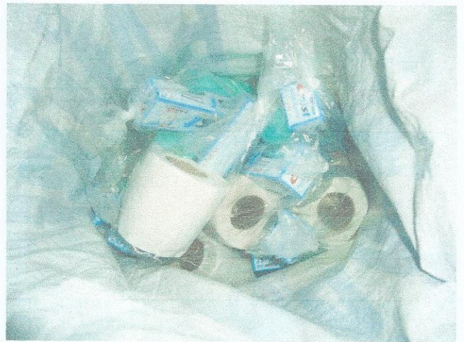
Utensilios de aseo personal donados por las Hermanas de la Caridad Iglesia Catolica