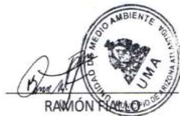
RAMÓN FALLO COORD. DE UMA