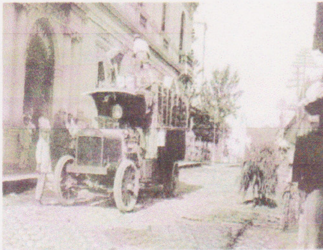
Camión Postal saliendo de lo que ahora es la Antigua Casa Presidencial donde funcionó temporalmente el Correo en La época de 1930

El edificio que abarca la mitad de una amplia cuadra se levantó con gruesos adobes, contando con un amplio patio interior rodeado de altos corredores siguiendo el estilo clásico de las construcciones coloniales.