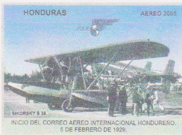
Estampilla Conmemorativa a los Primeros Medios de Transporte

La década del Siglo XX es digna de mencionarse porque dichos años corresponden a las solicitudes para establecer servicios aéreos en el país. Varias firmas nacionales como internacionales ofrecieron rutas para diferentes lugares, se efectuaron pruebas en demostración de la eficiencia de la aviación.