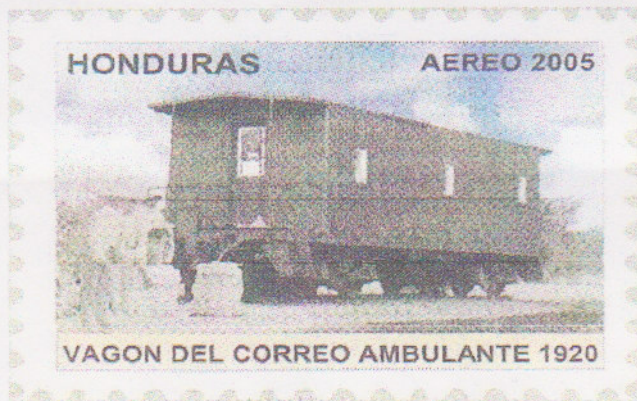
Estampilla Conmemorativa a los Primeros Medios de Transporte

El Correo en Honduras avanzó y se modernizó en diferentes épocas, pero la tecnología ha limitado en los últimos años un servicio que lo fue volviendo obsoleto, cuando las facilidades se optimizaron especialmente con la rapidez como sucede ahora con el sistema del Internet a través del correo electrónico o la telefonía celular.