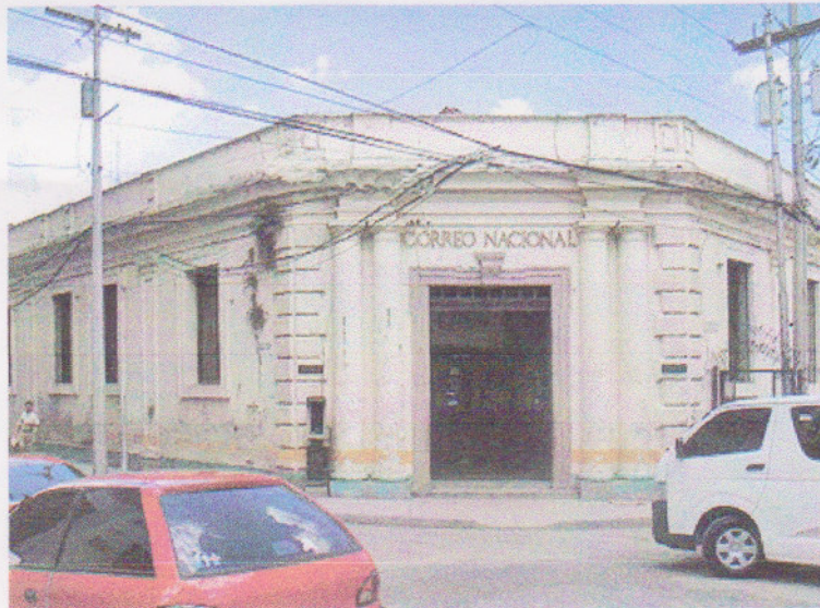
Actual Edificio del Correo Nacional modificado por el Dr. Juan Manuel Gálvez en 1,949

Durante el gobierno del Dr. Juan Manuel Gálvez (1949-1954), se modificó la fachada exterior del edificio en la esquina que queda hacia el lado norte del edificio, se abrió una puerta grande sostenida de dos columnas a cada lado que le da un toque elegante;