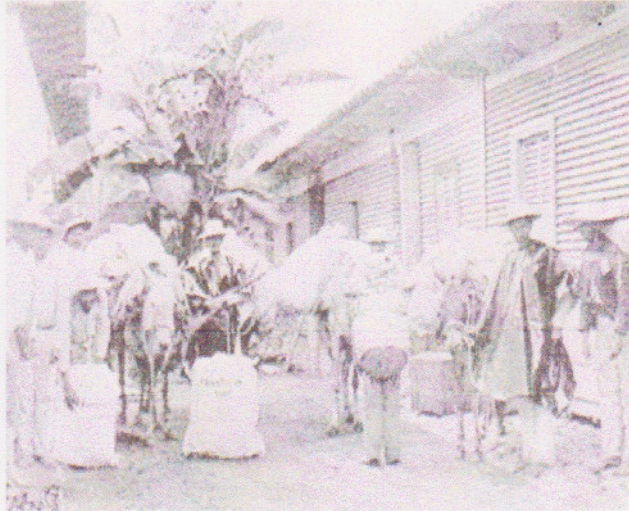
Carteros montando Correspondencia en sus Mulas en lo que es el actual local del Correo 1,897

Las oficinas postales se instalaron en un viejo inmueble construido en el Barrio Abajo a mediados del siglo XIX y que el sacerdote católico Monseñor José Leonardo Vijil acondicionó para instalar el primer hospicio en Tegucigalpa en 1868 que se conocía como la "Casa del Niño" y donde estuvo por muy pocos años la Escuela de Medicina.