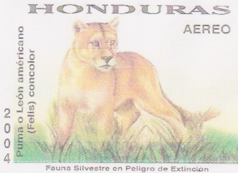
Puma/León Americano Fauna Silvestre en Peligro de Extinción 2004

Desde la última década la filatelia al igual que el correo han entrado en férrea competencia con los adelantos en materia de informática y comunicación. La creciente disponibilidad de entretenimientos electrónicos ha captado gran parte de la atención de jóvenes y adultos que ven en esta vasta gama de diversiones una novedosa forma de invertir el tiempo disponible.