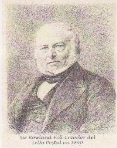
Sir Rowland Hill Creador del Sello Postal en 1840

El coleccionar sellos o estampillas de correo debe ser tan viejo como el sello en sí, que nació oficialmente en Gran Bretaña en el año de 1840 por el inglés Sir Rowland Hill quien creó el sello postal adhesivo para franquear la correspondencia, sin imaginarse que aquel pedacito de papel impreso daría origen a una afición de dimensiones mundiales; que rápidamente iba a acuñar un nombre específico: "filatelia", y que esta a su vez propulsaría un comercio internacional multimillonario vinculado a todos los países del mundo..