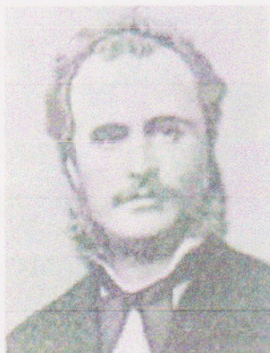
DR. Marco Aurelio Soto

En 1877, durante el gobierno del Dr. Marco Aurelio Soto se organizó el servicio de correos donde funcionaba anteriormente La Escuela de Medicina, la cual contaba con laboratorios, museo de mineralogía, zoología, jardín botánico y una capilla para enseñanza espiritual. Designándose como primer director al maestro cubano don Tomás Estrada Palma (FOTO 2).