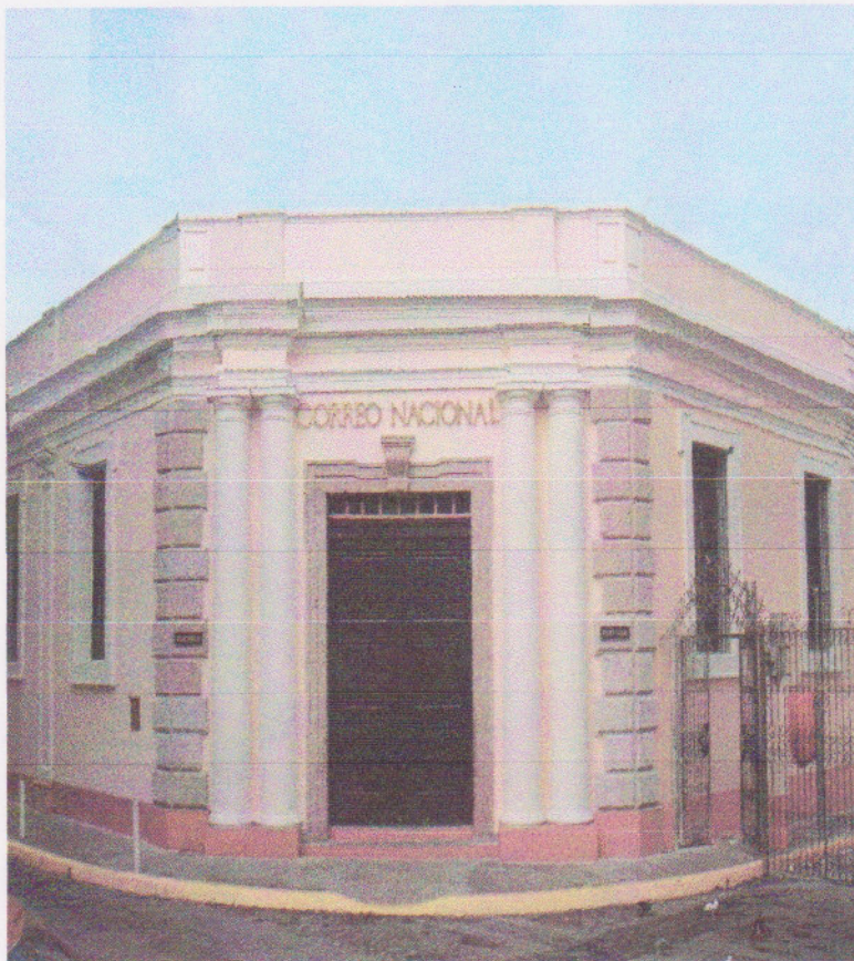
Edificio Correo Nacional Remodelado Por los mismos Empleados en el año 2,009

Se procedió también a arreglar el interior con la creación de diversas secciones de madera y vidrio, para brindar mayor comodidad y atención al público.